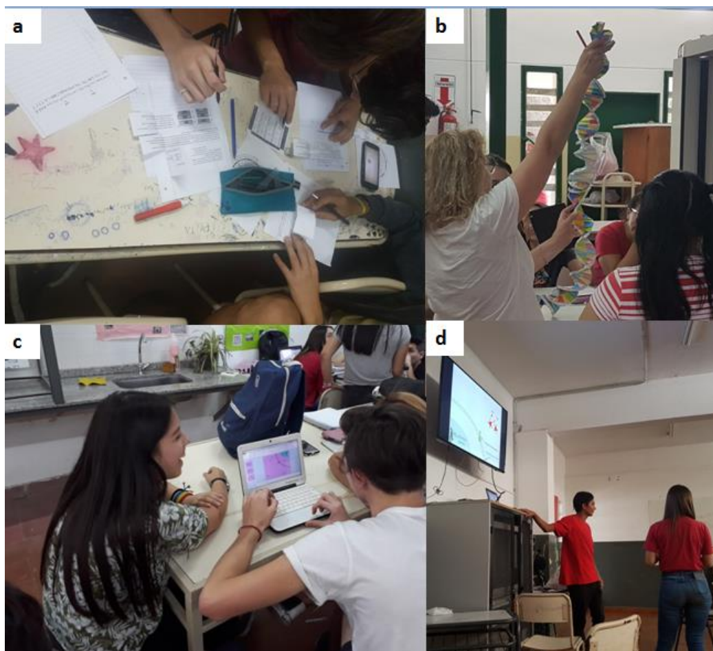
Figura 1: a) Resolución de situaciones de problemáticas de lápiz y papel; b) construcción de una molécula de ADN con la técnica de origami; c) construcción de una presentación dinámica; d) exposición oral a todo el grupo clase.

Para la construcción de la representación se puso a disposición del grupo de estudiantes una traducción de la presentación en Power Point de “PRACCIS” (Promoting Reasoning and Conceptual Change in Science) 2 referida a la temática.