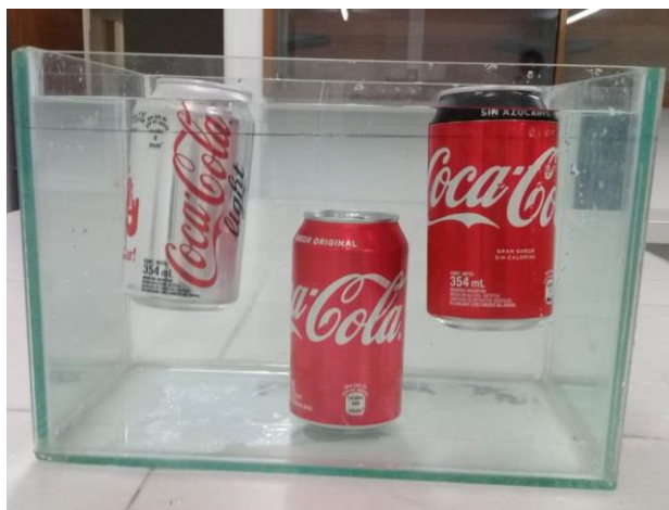
Figura 1. Foto de la experiencia realizada por el grupo 1

A continuación se realizó la secuencia didáctica consensuada (lectura comprensiva, guía de actividades teóricas y de aplicación).