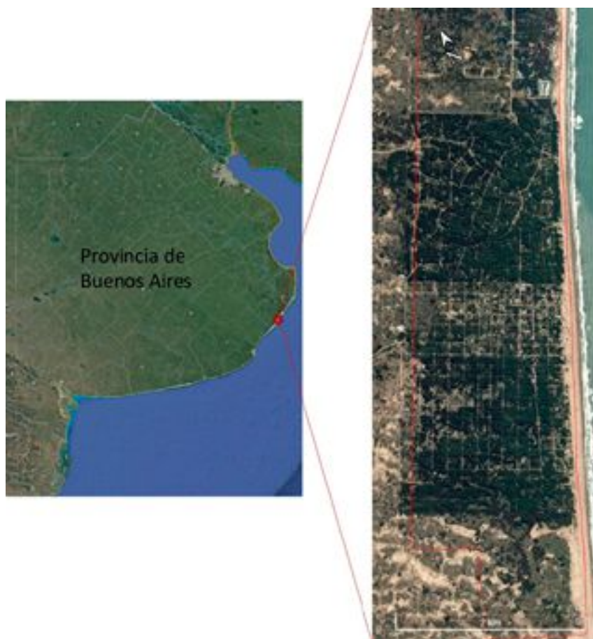
Figura 1. Área de estudio de arbolado en dunas costeras bonaerenses.

La zona se encuentra dentro de la región pampeana con predominio del turismo urbano costero como dinamizador de la economía local 1 .