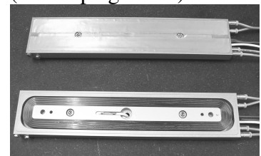
Bild 3 Spulenkühlung