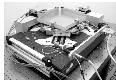
Bild 1 PMS100-3 mit Lasermesssystem

Beim Betrieb eines Direktantriebssystems in einem geschlossenen Regelkreis leistet das eingesetzte Messsystem einen entscheidenden Beitrag zur Verringerung der Positionierunsicherheit. Auf Basis des aerostatisch geführten Direktantriebssystems PMS100-3 [3] mit einem Verfahrbereich von \varnothing 100 mm und einer Positionierunsicherheit von u = 1\mu\text{m} , wurde hierzu eine