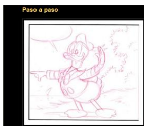
Gráfico nº 8: Aprende a dibujar