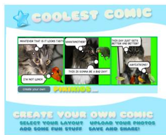
Gráfico n° 4: Creación de cómics online