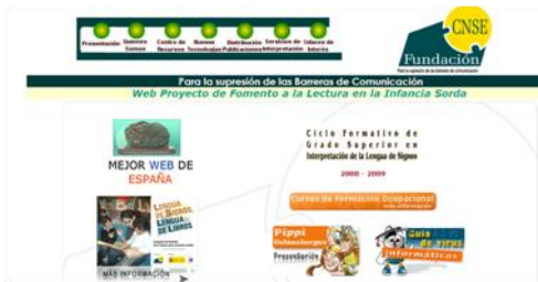
Gráfico n° 5: Lengua de signos española