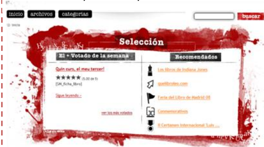
Gráfico n° 2: Espacio Libros