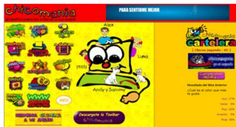
Gráfico n° 3: Chicomania.com