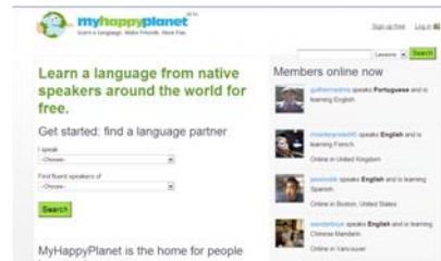
Gráfico n° 6: My happy planet