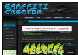
Gráfico nº 10: GraffitiCreator