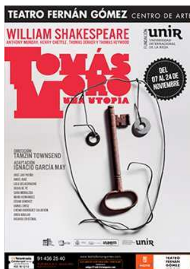
Ilustración 2. Cartel de la obra Tomas Moro, una utopía

Si analizamos este espectáculo como un mensaje comunicativo reconocemos la presencia de un emisor, un receptor, un mensaje, un contexto, un código y un canal. Referenciamos estos conceptos en la obra Tomás Moro una utopía y nos detenemos en los parámetros que nos ayuden a una mejor comprensión del espectáculo.