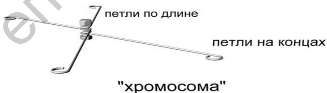
Рисунок 3 – Воссоздание «хромосомы» из проволоки и небольшого металлического стержня

Углубляясь в строение человека, можно найти конструкцию связи, подобную ДНК, узлы соединения, которого имеют своеобразную модель закручивания [2]. Если взять за основу это строение и воссоздать «хромосому» из проволоки и небольшого металлического стержня (рис. 3), получим основу для соединения нескольких узловых конструкций в полигоны и изготовление сетчатой основы. Данная система может получить широкое практическое применения в создании гибких форм.