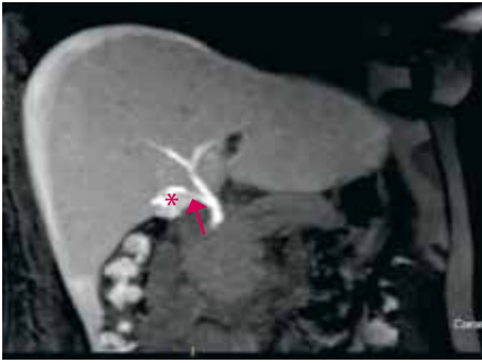
KUVA 2. Sappivuoto sappirakon tiehyestä (ductus cysticus) sappirakon poistoleikkauksen jälkeen. Gadoksetiinihappotehosteisesti kuvattiin myös eritysvaiheen kuvat (60 minuuttia tehosteaineen antamisesta). Tehosteainetta näkyy sappirakon tiehyen tyngän (nuoli) viereisessä nestekertymässä (tähti).