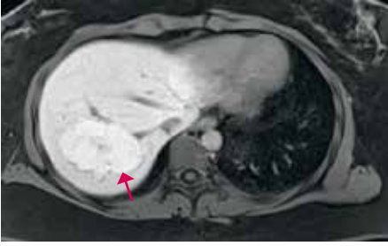
KUVA 4. Tyypillinen, tasaisesti maksasoluspesifistä tehosteainetta keräävä maksan fokaalinen nodulaarinen hyperplasia.