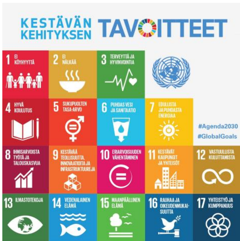
YK:n kestävänsä kehityksen Agenda 2030 -tavoitteet. Lähde: https://www.ykliitto.fi/yk70v/yk/kehitys/post-2015 .

YK:n Kestävän kehityksen Agenda 2030 koostuu 17:stä päätavoitteesta, joiden grafiikka on esitetty alla. Päätavoitteista on johdettu 169 alatavoitetta. Vuonna 2015 hyväksytty, jäsenmaiden neuvottelema Agenda 2030 oli jatkumoa YK:n vuonna 2000 hyväksymille vuosituhatvuotuisille, jotka olivat ensimmäinen globaali sosiaalista oikeudenmukaisuutta koskenut sopimus. Sopimus ei tosin ollut juridisesti velvoittava. Agenda 2030:n tavoitteena on ollut määrittellä toimintaehdot sosiaalisesti ja ekologisesti kestävänsä talouskasvun takaamiseksi. Agenda 2030 -tavoitteiden kohdalla on haluttu alusta lähtien osallistaa mukaan jäsenmaiden valtiollisten toimijoiden lisäksi kansalaisjärjestöjä ja yritysmaailman edustajia (Halonen 2017, 8, 13–14). Lisäksi toiveissa olisi saada julkishallinnon, kansalaisyhteiskunnan, yritysmaailman ja tieteen tekijöiden välille aiempaa enemmän yhteistyötä. Tämä voisi avata uudenlaisia mahdollisuuksia taloudellisesti, sosiaalisesti ja ekologisesti kestävälle liiketoiminnalle, toteavat presidenttikausiensa jälkeen YK-foorumeilla kestävänsä kehityksen kysymyksiin keskittynyt presidentti Tarja Halonen ja tulevaisuustutkija Aleksi Neuvonen Agenda 2030 -tavoitteita käsittelevän yleistajuisen kirjan artikkelissaan (Halonen & Neuvonen 2017, 197). Edellä mainituista sidosryhmistä yritysmaailman edustus on oman tutkielmani kannalta erityisen kiinnostava.