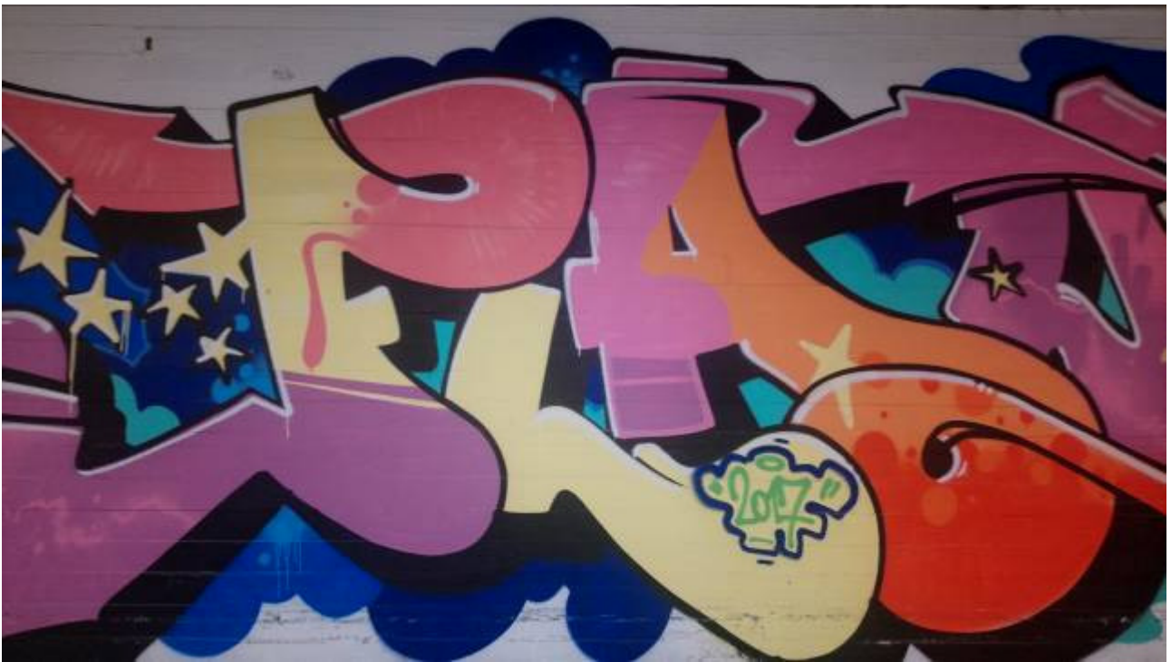
Kuva 2: Flaum, Flaumone , 2017, sekateknikka, Meilahden sairaalan alikulkutunneli, Helsinki.