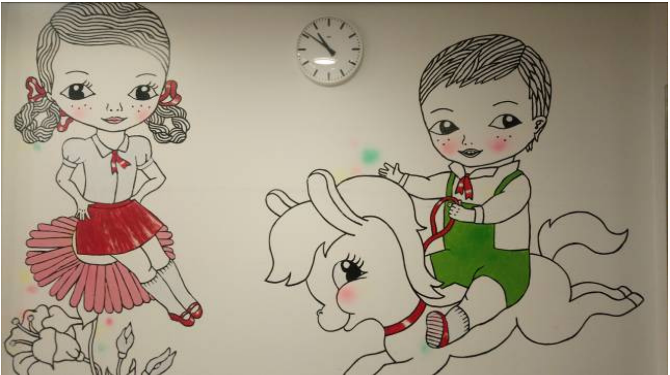
Kuva 1: Katja Tukiainen, Nimetön , 2010, Lastenklintikka, Helsinki.