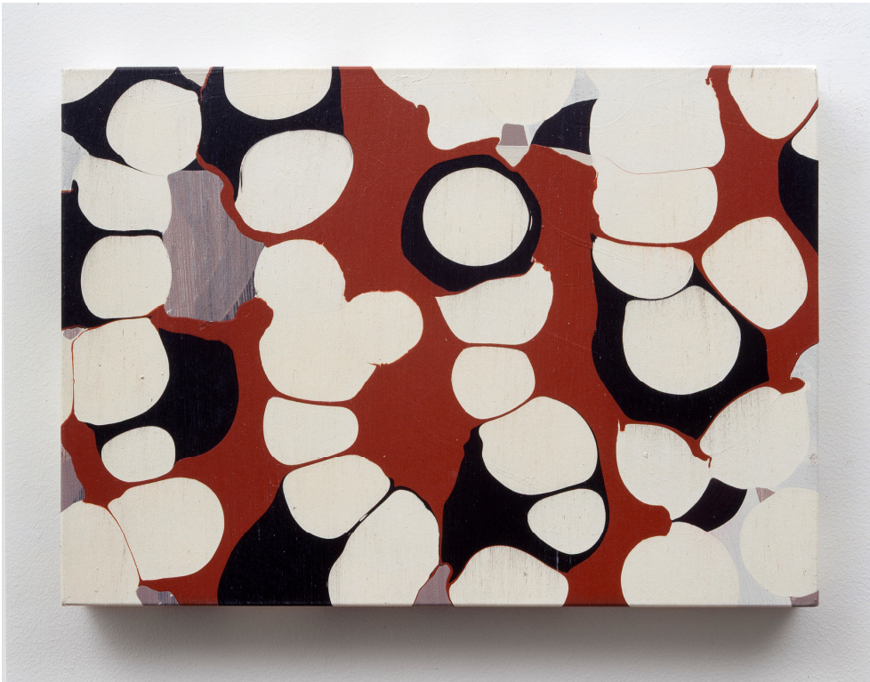
Kuva 5: Jukka Mäkelä, teossarjasta My Garden VI , 2003, akryyli kankaalle, 50 x 70 cm, HusLab, Meilahti, Helsinki.