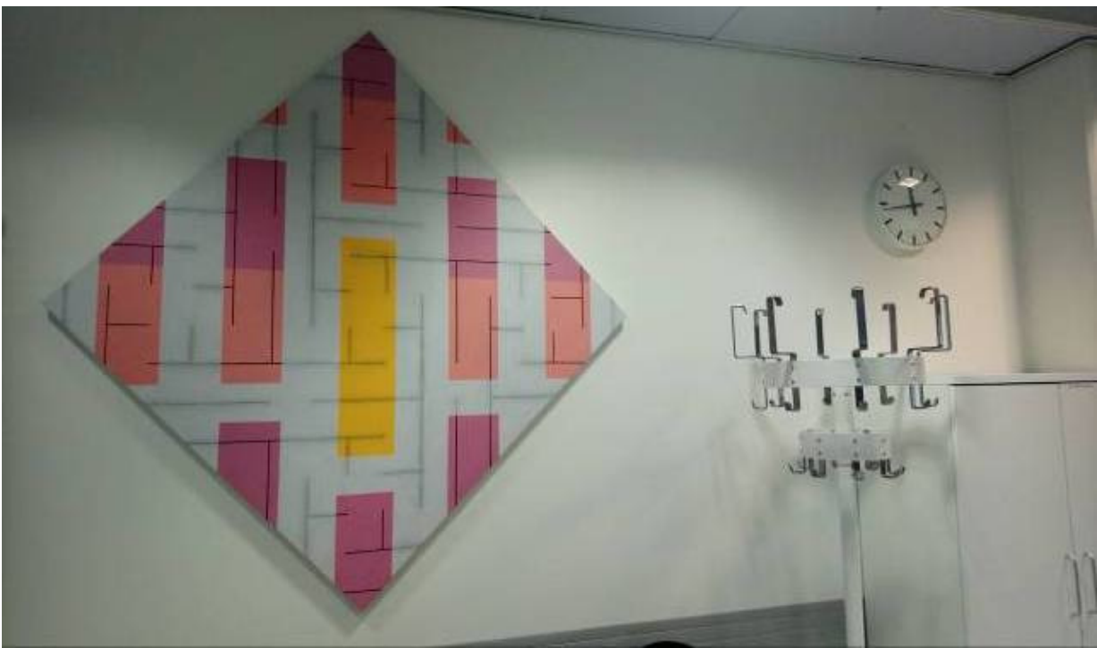
Kuva 8:Jorma Hautala, Kelttiläinen I , 2003, akryyli kankaalle, 160 x 160 cm.