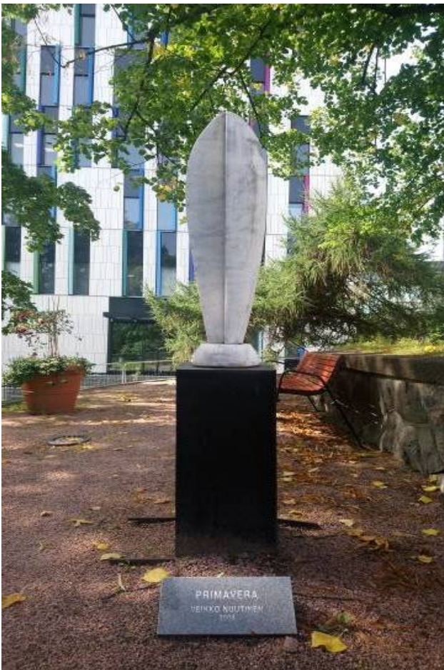
Kuva 6: Veikko Nuutinen, Primavera , 2009, marmori, Naistenklinikan veistospuisto, Helsinki.