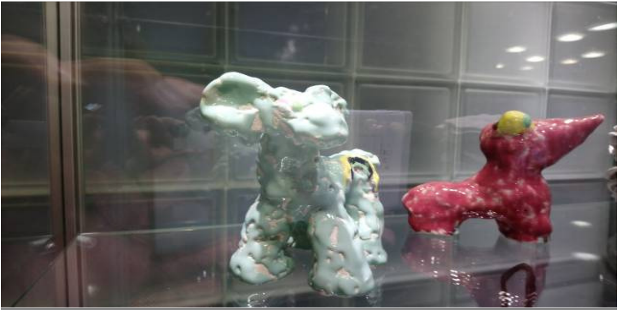
Kuva 7: Jasmin Anoschkin, Bambi Minttu , 2015, lasitettu keramiikka, n.17 x 20 cm.