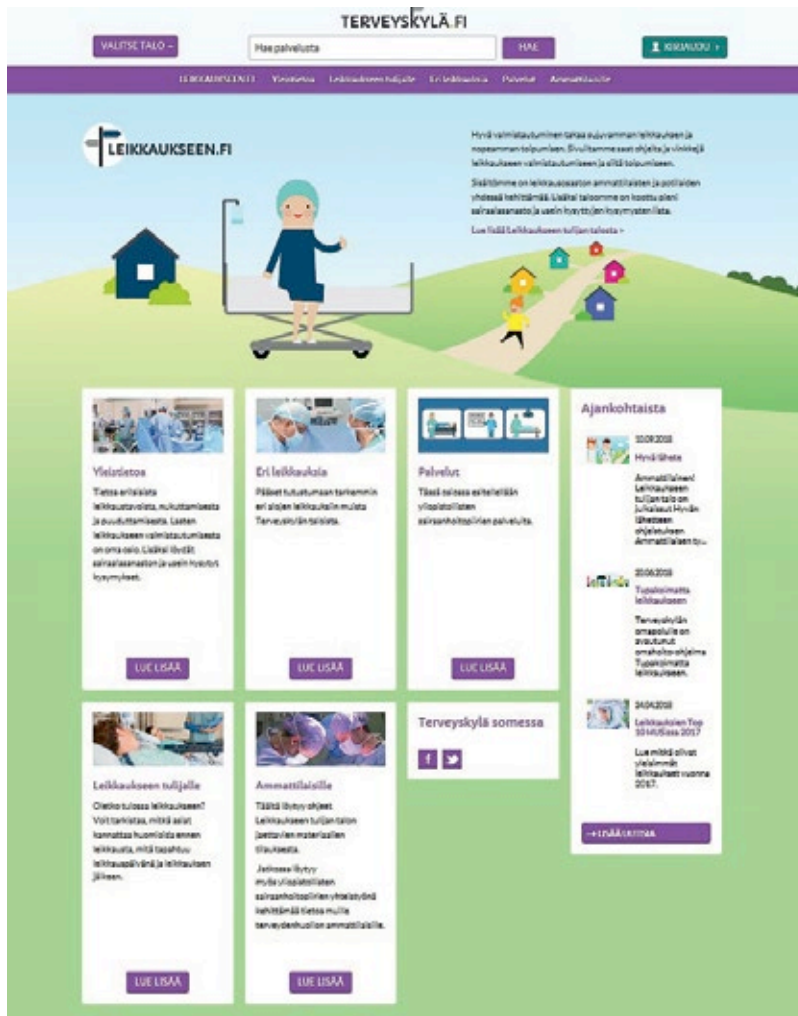
Kuva 1. Internetsivun www.leikkauksen.fi etusivu.