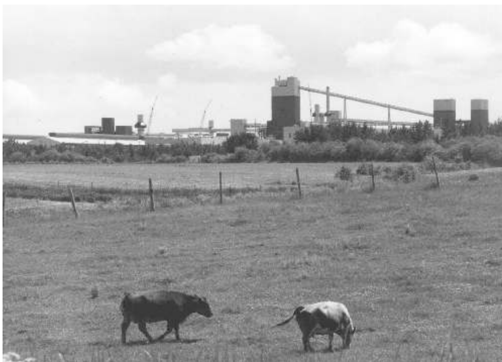
Photo 1. Point de vue sur le « nouveau » paysage rural suite à l'implantation du mégacomplexe industriel d'Alcan : hors des référents traditionnels.