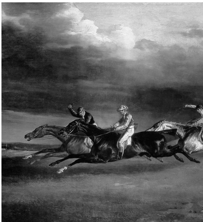
Fig. 1. T. Géricault, Le Derby de 1821 à Epsom (détail), huile sur toile, 92 x 122 cm, 1821, coll. musée du Louvre (phot. RMN/Gérard Blot).