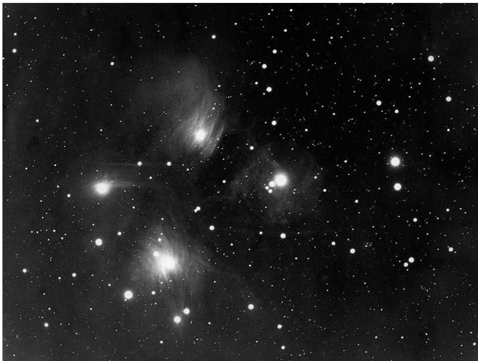
Fig. 4. F. Quéniisset, « Les Pléiades et leurs nébulosités intérieures », papier baryté, 16,5 x 22,1 cm, 1933, fonds Camille Flammarion, Société astronomique de France.