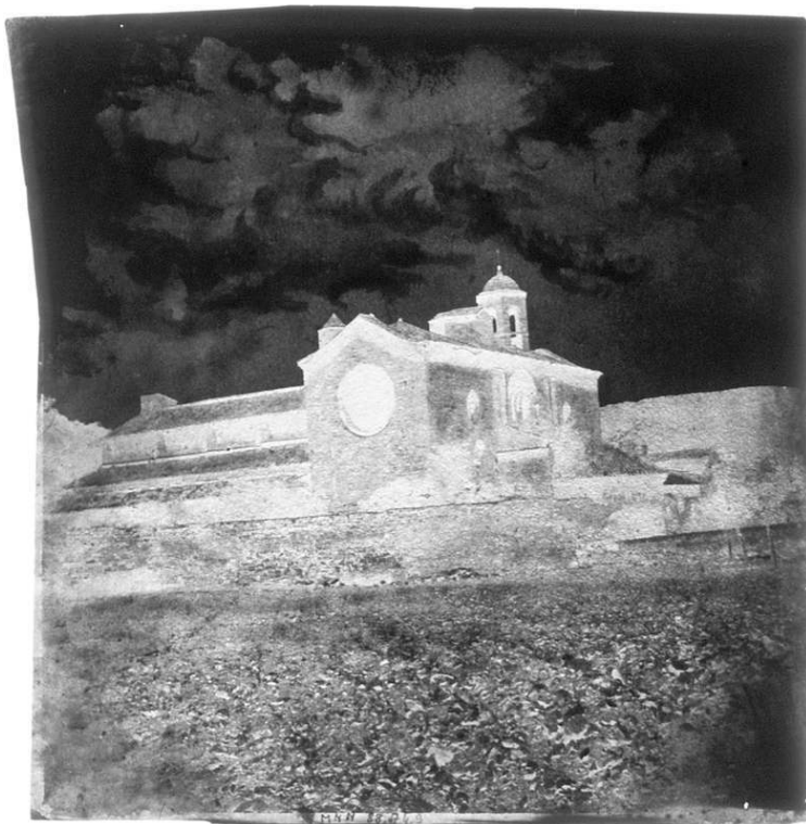
Fig. 2. Anon. (H. B.), vue générale de l'église de Fontfroide, Pyrénées-orientales (ciel peint), négatif papier, 18,7 x 18,2 cm, 1855, coll. musée Nicéphore-Niépce.