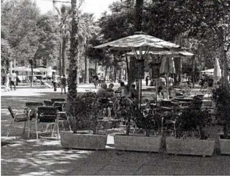
Figure 7. La Rambla del Raval, un espace touristique. Sept. 2006.

âgées sur le banc), Indo-Pakistanaï (le jeune homme debout au premier plan)... On remarquera l'absence de femmes. L'espace public serait-il un espace essentiellement masculin 35 ? Vivant et populaire, le Raval reste un des foyers principaux de l'immigration à Barcelone, une population qui coexiste, parfois à quelques mètres, avec les touristes ou les nouveaux arrivants, comme en témoigne la figure 7.