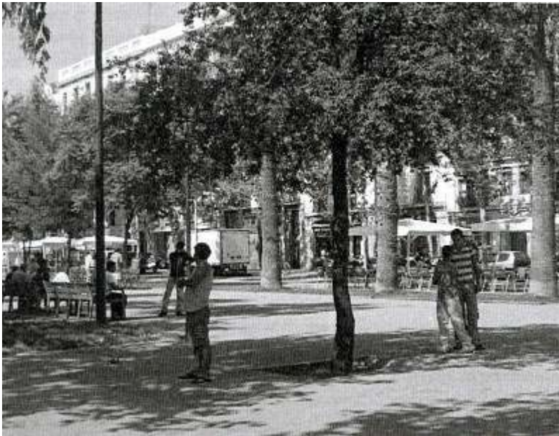
Figure 6. La Rambla del Raval, un espace public. Sept. 2006.