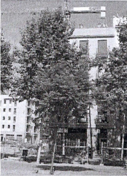
Figure 2. La dynamique immobilière de la Rambla del Raval. Sept. 2006.

remettre en cause l'identification d'une population à un quartier ; questionnement d'autant plus fondamental que l'on se trouve ici au cœur de l'ancien Barrio Chino chargé de mythes.