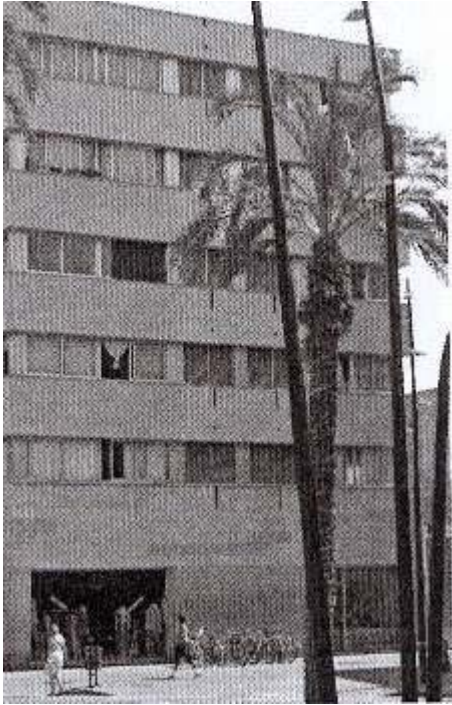
Figure 1 : Un immeuble récent sur la Rambla del Raval. Sept. 2006.

l'année 28 . Au pied du bâtiment, un magasin de vêtements a installé sa vitrine. Enfin, au premier plan, les palmiers apportent un peu d'ombre à la Rambla. Quelle image du quartier ancien ce bâtiment nous renvoie-t-il ? Ne favorise-t-il pas l'émergence d'une nouvelle image du centre, celle d'un quartier rajeuni, moderne, voire « normé 29 », qui joue parfois sur des stéréotypes, avec des palmiers censés rappeler la « méditerranéité » du lieu comme pour mieux l'ancrer dans le local 30 ? Les nouvelles populations ou les nouveaux usages ne sont pas seuls à favoriser un nouveau regard sur le centre ; le type de bâti, bien qu'il contraste brutalement avec l'architecture traditionnelle du centre ancien de Barcelone, y participe également.