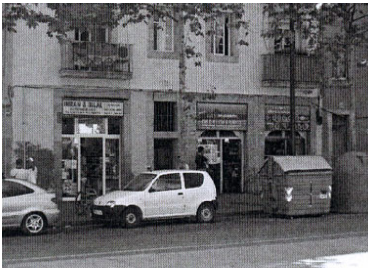
Figure 3. Un paysage commercial à forte composante migratoire. Sept. 2006.