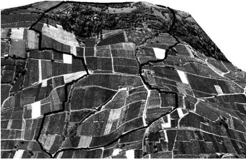
Bassin versant de Rouffach