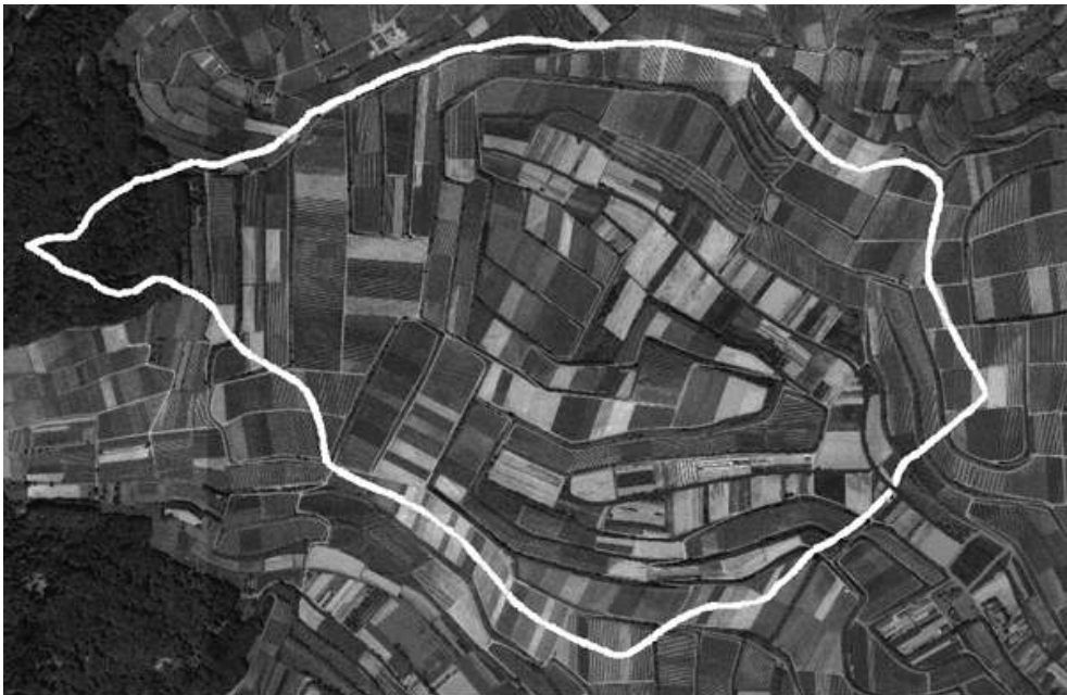
Bassin versant d'Eichstetten