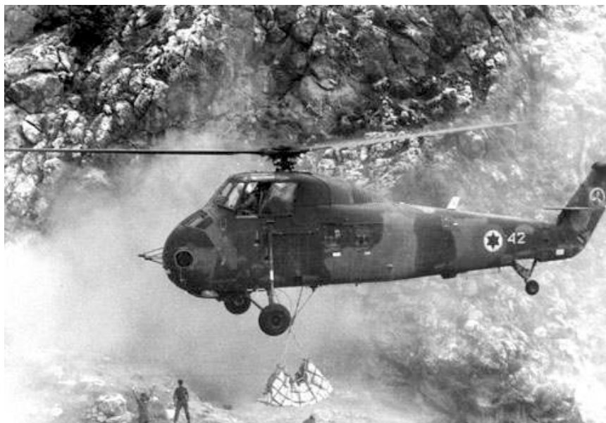
Figure 3 : Enlèvement par hélicoptère du squelette Qafzeh 9 en septembre 1967.

Toutefois, à la demande de la municipalité de Nazareth nous avons entrepris, toujours avec O. Bar-Yosef, la remise en état du gisement en 1996 et 1997. La ville avait le projet d'aménager le gisement et de construire un musée de site. Nous avons profité de cette opération pour étoffer un peu les séries lithiques du Paléolithique supérieur, dont certaines étaient trop réduites pour permettre une identification incontestable des cultures. Au cours de ces travaux nous avons aussi tamisé des sédiments provenant d'un petit effondrement de la partie sud-est de la fouille. Ils renfermaient un fragment de mandibule d'enfant avec une molaire déciduale et la couronne d'une canine adulte. L'origine de ces pièces a pu être établie avec une bonne précision du fait de la faible importance de l'éboulement, de la nature des sédiments et de l'aspect des os. Ils proviennent des niveaux de base, c'est-à-dire des couches XIX à XXI. Malheureusement le projet d'aménagement n'a pas encore pu se concrétiser et nous avons recouvert les coupes.