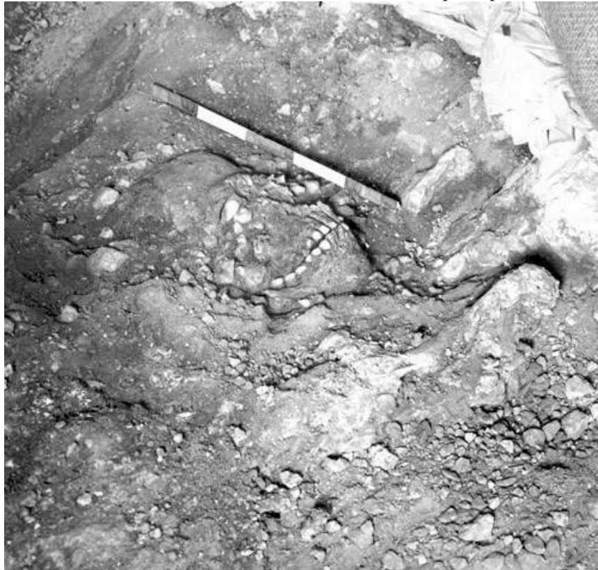
Figure 2 : Le crâne de Qafzeh 7 en cours de dégagement au cours de la campagne de fouilles de 1934.

première année a porté sur l'intérieur de la cavité où fut mise en évidence une importante stratigraphie du Paléolithique supérieur et moyen. Un frontal humain a été exhumé d'une couche remaniée. La partie antérieure d'une calotte crânienne et deux fragments de mandibule furent « trouvés in situ dans une couche du Paléolithique supérieur ».