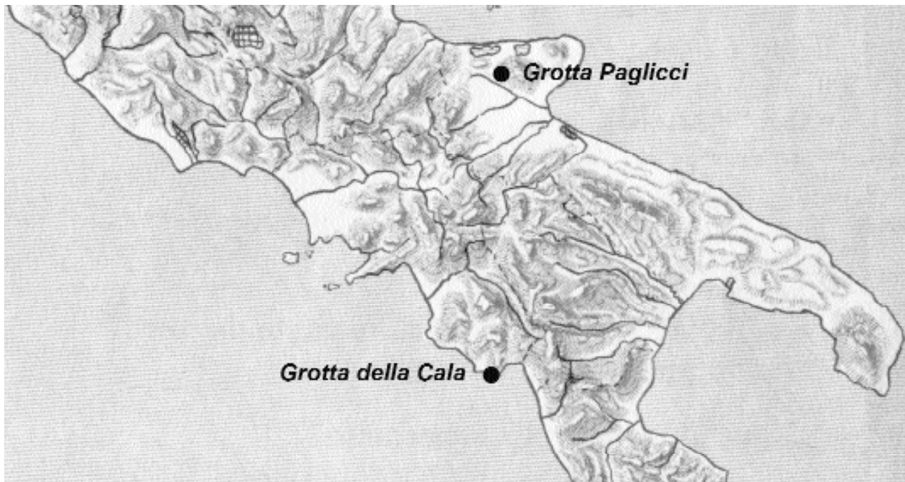
Figure 1 – Localisation des deux sites gravettiens.