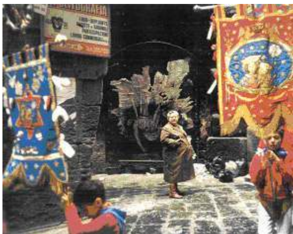
Ernest Pignon-Ernest, Mise au tombeau , Naples, 1988, dessin éphémère sur papier. Avec l'aimable autorisation de l'artiste.