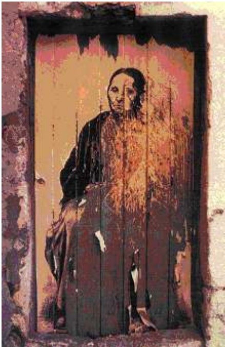
Ernest Pignon-Ernest, Martéguale , Martigues, 1982, dessin éphémère sur papier.