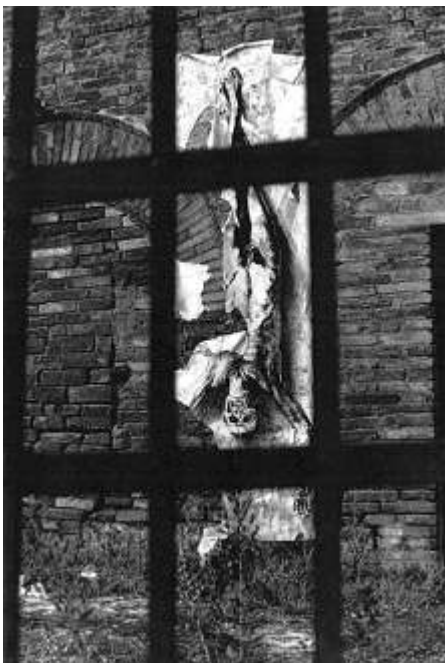
Ernest Pignon-Ernest, Pasolini , Certaldo, 1980, dessin éphémère sur papier. Avec l'aimable autorisation de l'artiste.