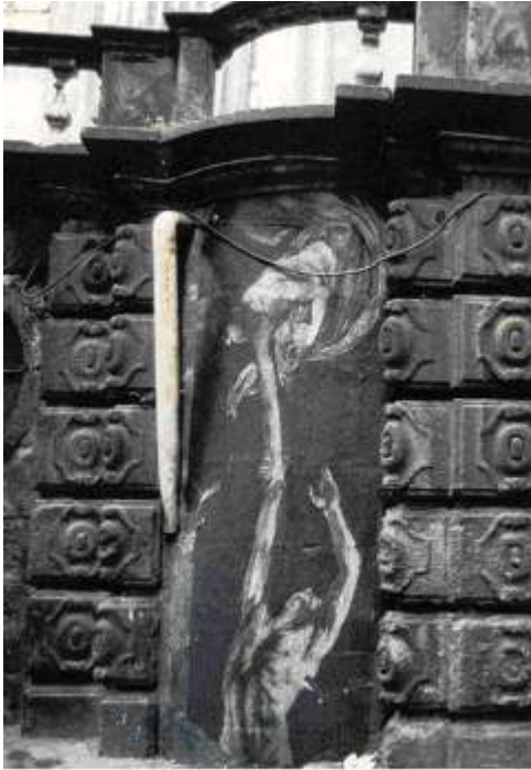
Ernest Pignon-Ernest, Purgatoire , Naples, 1990, dessin éphémère sur papier.