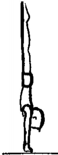
Figure 2 : l'appui tendu renversé

Nous éclairons empiriquement les considérations qui précèdent par l'étude d'extraits de corpus issus de deux séances d'EPS conçues et mises en œuvre dans le cadre de cette méthodologie. Les savoirs en jeu sont identiques dans les deux séances et renvoient à l'enseignement-apprentissage d'un élément clé en gymnastique « l'appui tendu renversé » (figure 2) qui se caractérise par une double construction : celle des alignements bras – tronc – jambes à l'appui manuel renversé et celle de nouveaux repères visuels et proprioceptifs dans cette position inhabituelle.