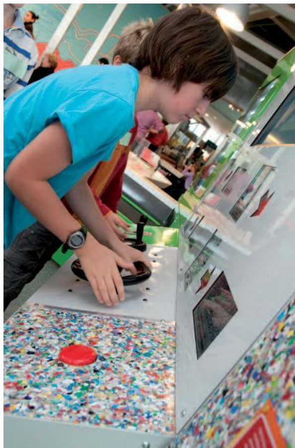
Le Vaisseau : atelier « Les bouteilles en plastique, ça se recycle ! Univers Je fabrique »

Ces nouvelles « règles » seront effectives dès les prochaines rencontres. Elles répondent bien à un souci d'applicabilité des conseils émis par les membres : expérimenter, observer, c'est mieux connaître l'équipement, ses particularités et ses visiteurs, et donc mieux répondre aux enjeux de son développement.