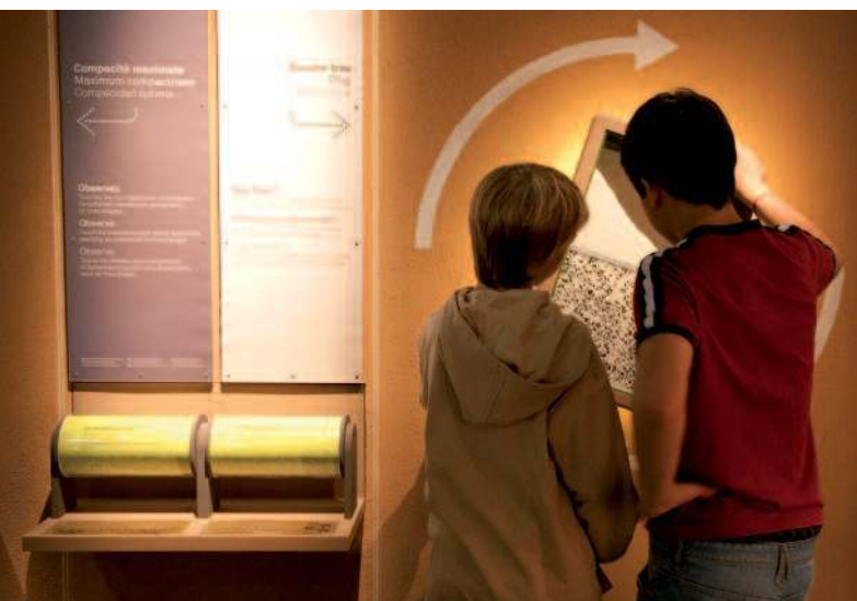
Le Vaisseau : manip sur la compacité

Les travaux du Conseil font l'objet d'une restitution sous forme de compte-rendu diffusé quelques semaines après le Conseil. Les avis relevés sont ensuite traités en interne et leur application (ou non application) discutée lors du Conseil scientifique et pédagogique suivant.