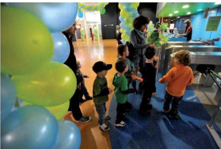
Accueil des visiteurs, le jour du 1 000 000 e visiteur du Vaisseau

Les avis et appuis des personnalités du Conseil scientifique et pédagogique permettent d'asseoir la réputation