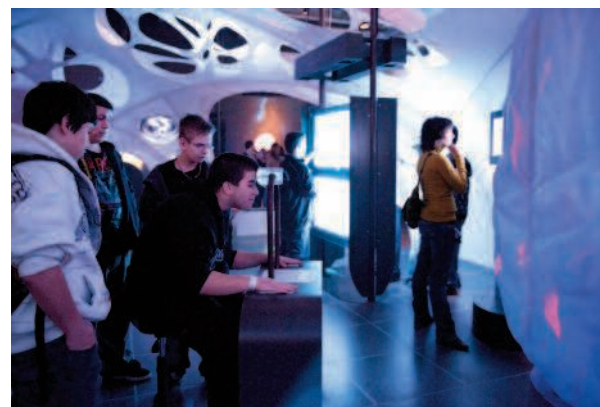
Des visiteurs expérimentent différents outils pédagogiques dans l'exposition Imagine !

Le concepteur d'un outil pédagogique devra, non seulement identifier les caractéristiques de l'activité proposée à l'apprenant mais aussi celle du type d'apprentissage sous jacent. On peut favoriser la découverte active en proposant de toucher des empreintes et des moulages, manipuler des objets, regarder et se poser des questions, faire des liens entre la ressemblance des spécimens afin de constituer des indices de parenté entre espèces et introduire le principe de classification biologique. Ainsi, l'activité proposera aux visiteurs d'observer ce qui lui est présenté, de