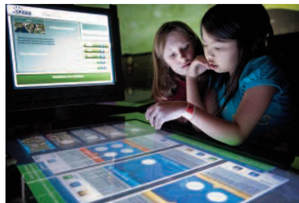
Dans le cadre du jeu interactif Mission Gaïa , présenté au Centre des sciences de Montréal, ces enfants réfléchissent à la solution à privilégier, suite à une catastrophe écologique ayant entraîné une contamination au mercure de poissons.

Plusieurs musées conçoivent et réalisent des guides de visite qui poursuivent des objectifs pédagogiques affirmés et favorisent une démarche éducative qui facilite