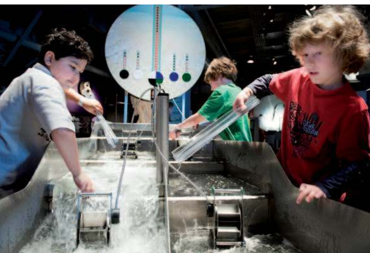
Cet outil pédagogique démontrant les principes des barrages hydrauliques est intégré à l'exposition Science 26 au Centre des sciences de Montréal

Après avoir rappelé quelques principes de base concernant la place des publics dans les musées et la fonction éducative de ces derniers, l'auteur envisage les différents aspects de la conception des outils pédagogiques, montrant d'une part que cette démarche ne se conçoit pas sans un mode d'évaluation des outils en question et d'autre part que dans ce domaine l'évaluation dite formative s'impose.