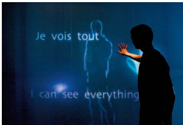
Exposition Imagine ! au Centre des sciences de Montréal

et de cerner les difficultés – les obstacles pédagogiques – que l'apprenant affrontera et d'imaginer des modes de remédiation pédagogique adéquats (Bloom, 1969) (6).