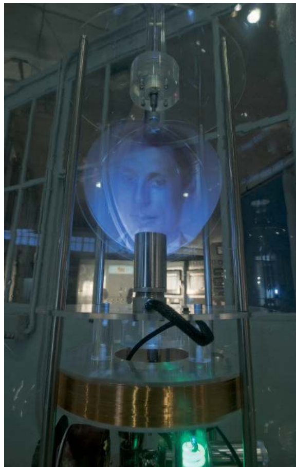
L'œuvre au rouge (réacteur en verre soufflé et acier, stroboscope) par Peter Keene © Isabel Tabelion et Roland Ménégon

S'agissant des acrobates de la science qui illustrent l'épopée scientifique de la famille Becquerel, un consensus s'est également dégagé sans difficulté. En revanche, le traitement par les artistes de la catastrophe de Tchernobyl a donné lieu à des discussions bien plus conflictuelles. La première esquisse