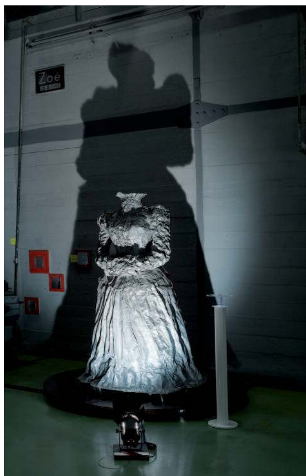
Dame de plomb (feuilles de plomb sur structure en bois et métal) par Piet'sO

Dans notre cas, c'est parce que nous utilisons très souvent cette pratique, mais aussi parce que le domaine couvert par l'exposition Vous avez dit Radioprotection ? Histoire de rayons X, de radioactivité et de radioprotection recouvrait un ensemble de thématiques, aussi complexes que sensibles, que nous avons considéré que l'approche artistique pouvait devenir un outil précieux de vulgarisation et d'appropriation. Le volet artistique devait toutefois être complété par un volet didactique. D'où l'idée d'une association entre des œuvres et des bornes didactiques. Par ailleurs l'équipe de production a préparé un catalogue de l'exposition qui présente les œuvres mais aussi une série de textes sur les diverses thématiques traitées par les vidéos.