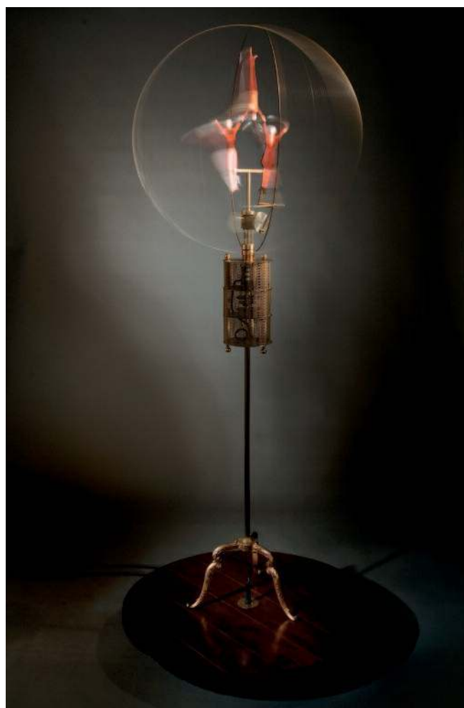
Fantastic Family Becquerel (dispositif mécanique et électronique en laiton et acier) par Peter Keene

L'équipe de production s'est, quant à elle, chargée de trouver des financements, de rassembler la documentation scientifique, de traduire l'information scientifique... Cet effort collectif nécessitait, de la