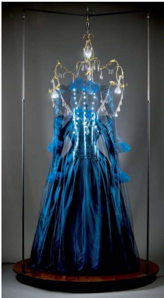
XX-L (dispositif mécanique et électronique, en tissu, plexiglas, laiton, et diodes lumineuses) par Piet'sO : sous les applaudissements d'une bande sonore, la robe s'élève jusqu'au lustre et à son contact, les deux ensembles s'illuminent.

MB : De fait, les questions qui touchent la radioactivité ne sauraient être abordées uniquement par le biais des sciences dures qui exigent entre autres des capacités à conceptualiser, mais doivent aussi passer par la médiation culturelle. Ces questions doivent donc trouver aussi un sens au travers de l'histoire, de la littérature, de la philosophie... L'exposition montre qu'une approche par la culture est possible à travers, par exemple les faits et les leçons de l'Histoire, y compris dans leurs dimensions les plus tragiques comme Hiroshima et Tchernobyl.