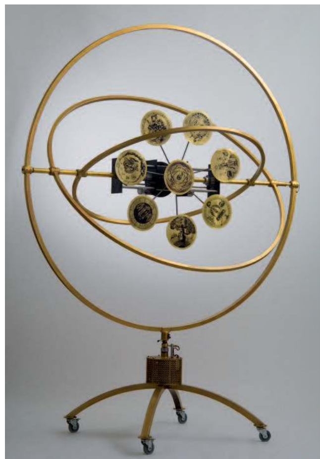
Horloge cosmique (dispositif mécanique et électronique en laiton et acier) par Piet'sO et Peter Keene : les rotations, celle horizontale du grand anneau, celles verticales et opposées des deux anneaux intermédiaires, sont temporisées et inscrivent dans l'espace une géométrie variable de la pièce encadrant huit gravures centrales.

Les œuvres ont été réalisées par Peter Keene et Piet'sO. Sur le volet artistique il faut également inclure Jean-Yves Pipaud, qui a réalisé les vidéos associées à chacune des œuvres. Chaque pièce de