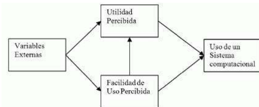
Figura 1. Versión abreviada del Modelo de Aceptación de Tecnología (TAM).