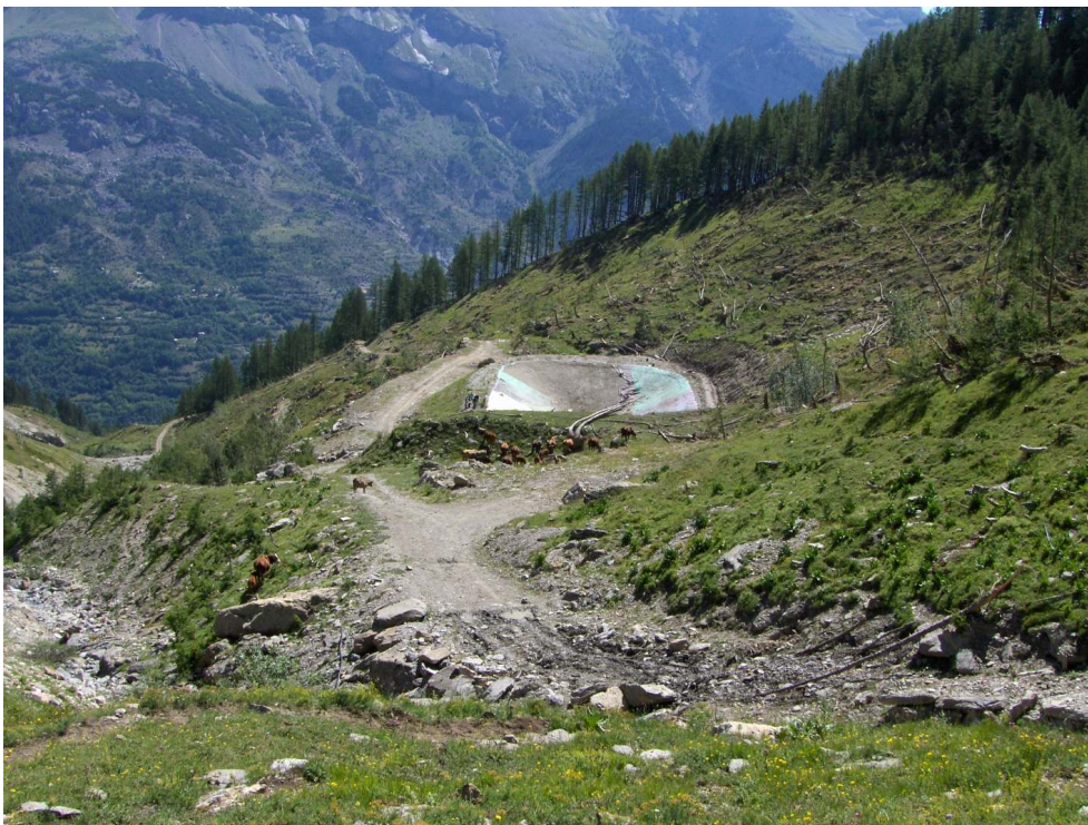
Figure 2 – Retenue d'altitude impactée par une avalanche