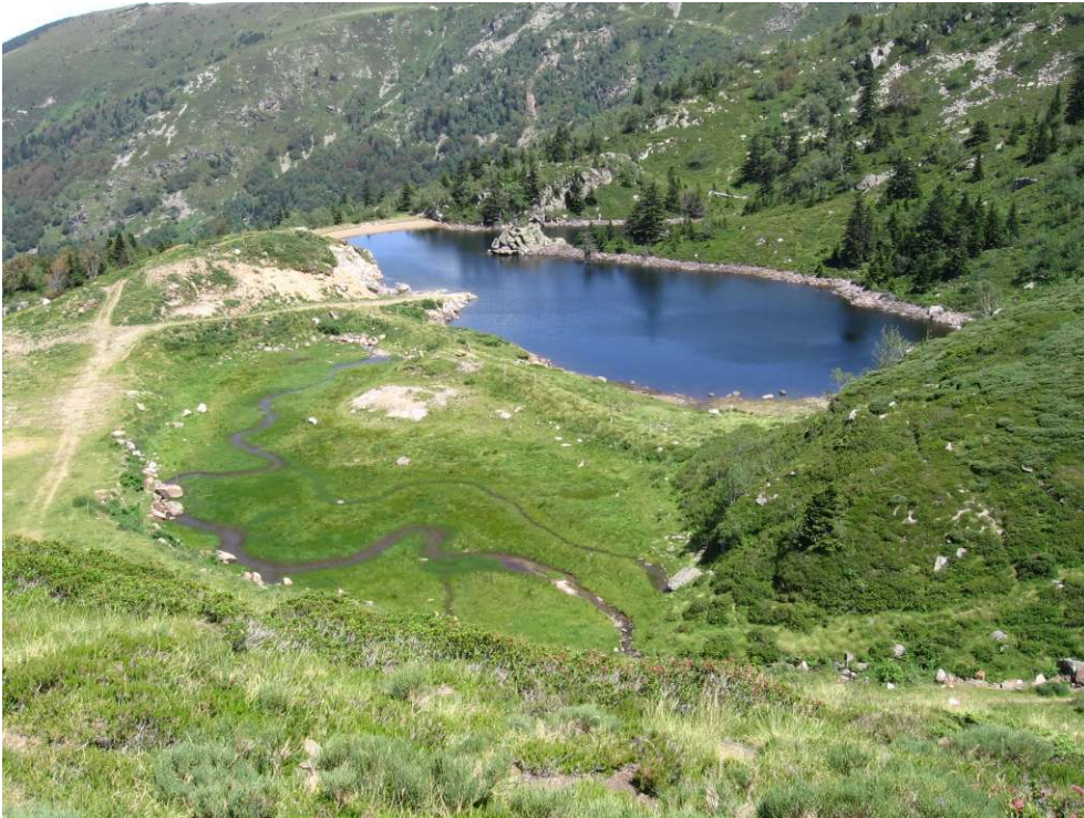
Figure 5 – Retenue partiellement construite sur une zone humide