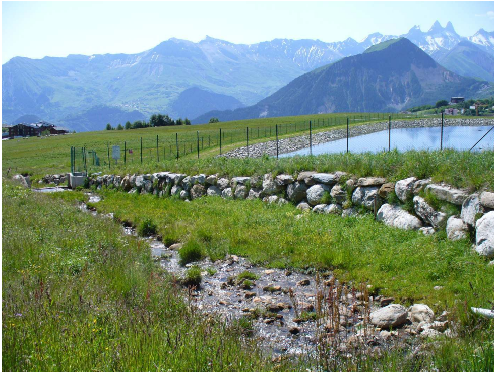
Figure 3 – Retenue soumise à un risque torrentiel avéré