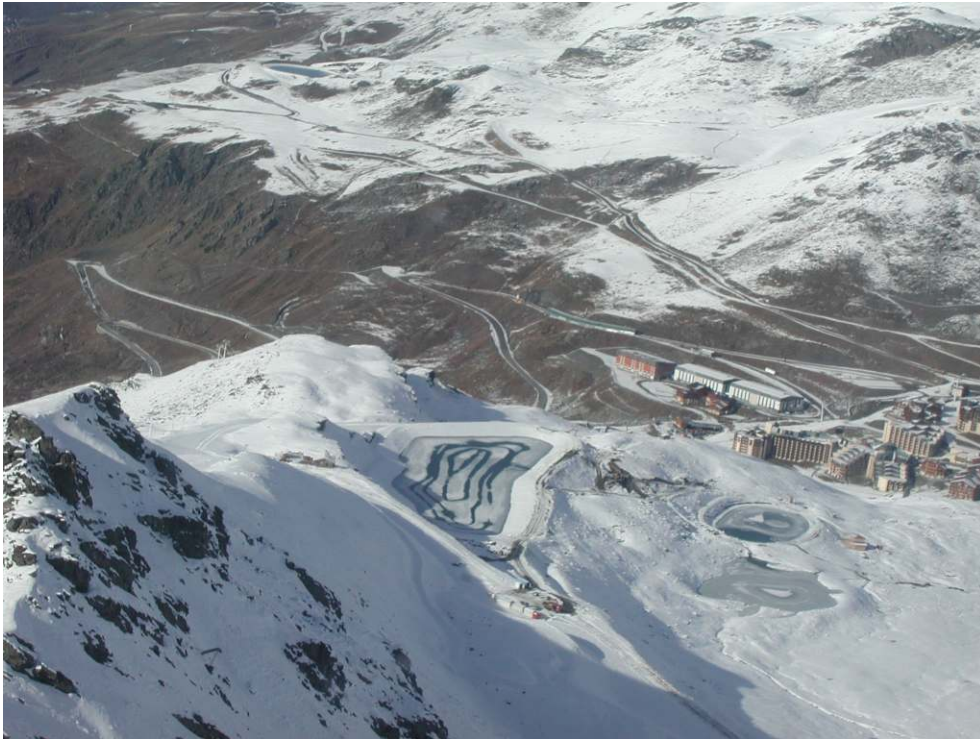
Figure 4 – Retenue d'altitude surplombant des enjeux