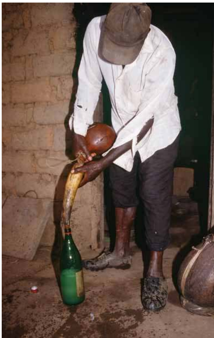
Transvasement de la sève de raphia qui, après fermentation, donnera du vin de raphia (Mankon, 2002).

La psychanalyse freudienne est au centre du débat. Elle souligne que le sujet est divisé entre une partie spécularisable et une autre – non-spécularisable - (dixit Lacan), c'est-à-dire entre une partie de lui-même dont le sujet perçoit l'image, et une partie de lui-même dont rien ne lui renvoie l'image et qu'il ne perçoit pas. Dans des termes plus freudiens que lacaniens, disons que je suis divisé entre le conscient d'une part, et le refoulé qui est en moi mais qui n'est pas moi d'autre part. Les sciences de l'homme et de la société ont abondamment illustré le fait que le sujet est soumis à des déterminations internes et externes, qu'il est mal armé pour percevoir, analyser, et encore moins contrôler. On comprend l'importance de ce débat si l'on se souvient que le sujet est un corps et a un corps. La manière dont on conceptualise le corps dépend des termes dans lesquels on pose ce débat.