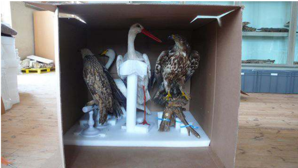
Figure 8 - Oiseaux mis en carton.