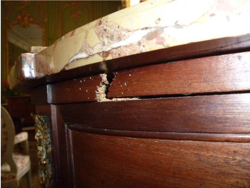
Altérations structurelles : rupture structurelle. Phot. Stetten, Isabelle. © Bouges-le-Château, juin 2011.