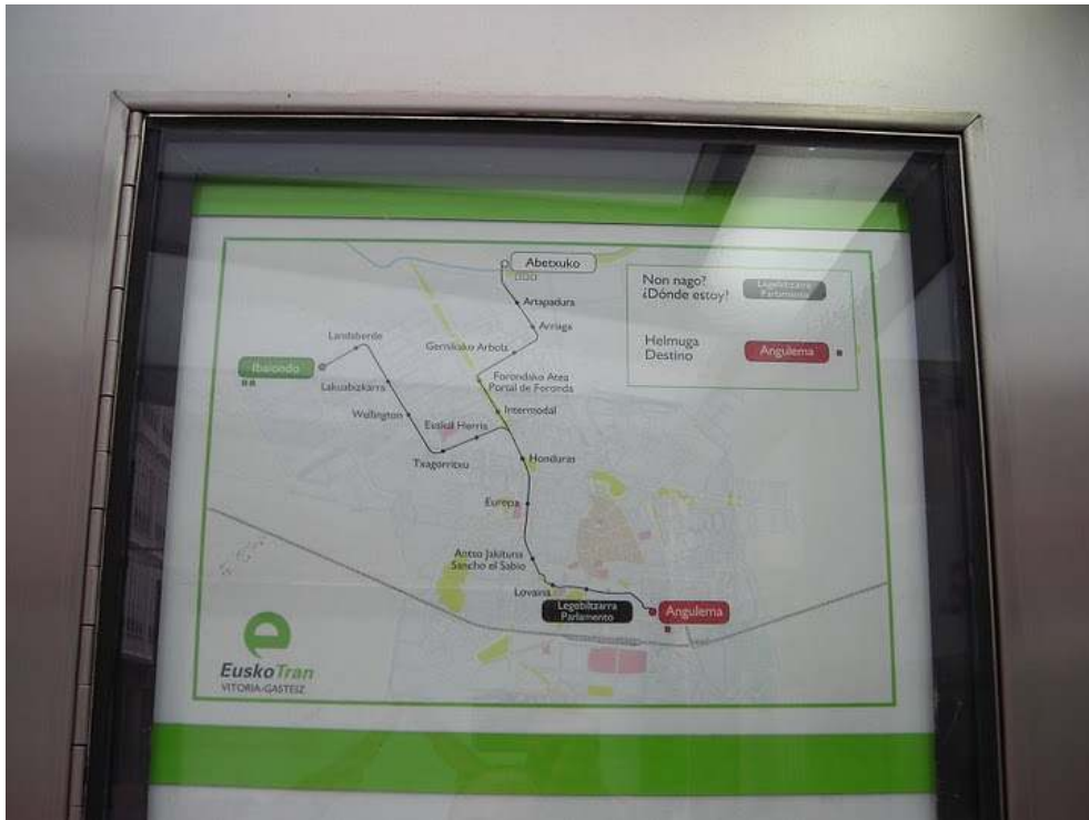
Figure 3 : Panneau d'indication avec le plan du tramway à Vitoria-Gasteiz.

Auteur : Miguel Pazos Otón. Date 20.03.2010