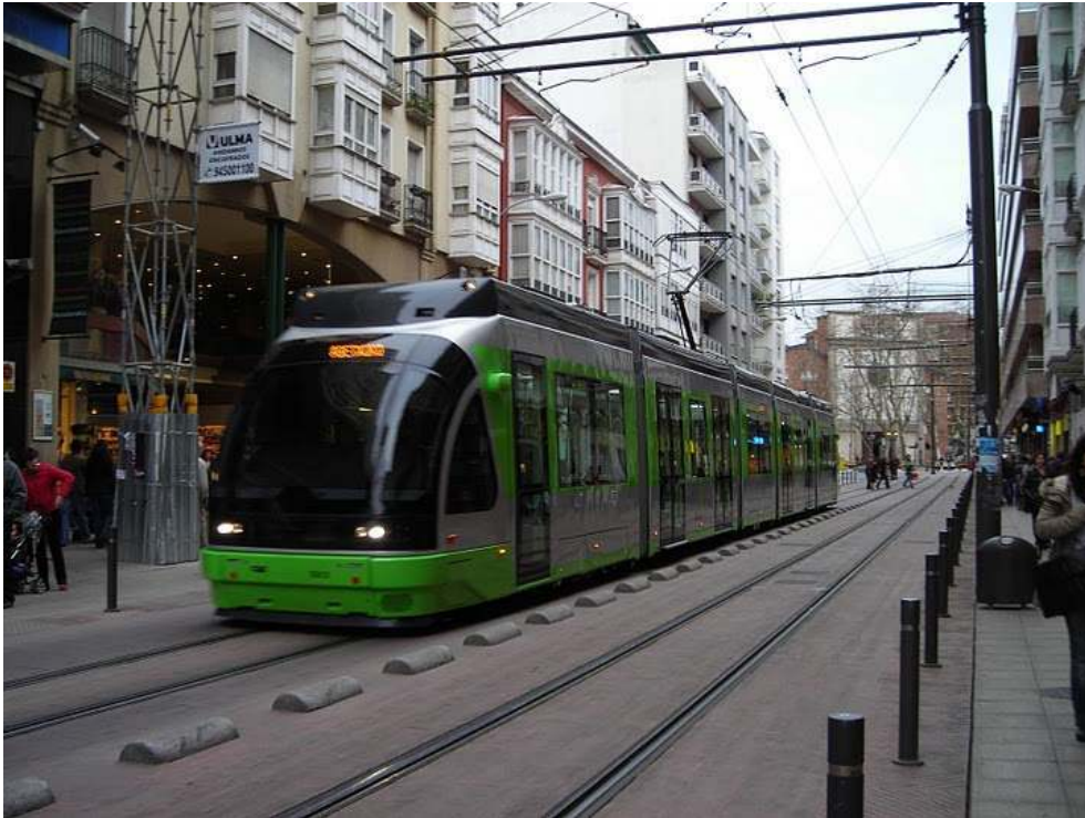
Figure 2 : Le tramway circulant dans la Calle General Álava

Date: 20.03.2010