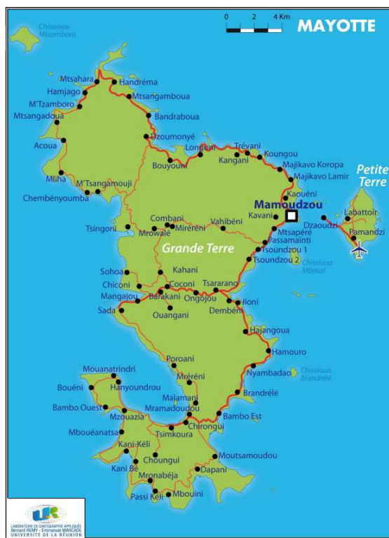
Figure 2 - L'archipel de Mayotte