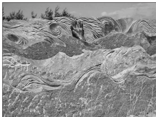
Photo 3 : monument commémoratif de la tempête de février 1953 en Zélande. La faiblesse de l'homme face aux flots marins est clairement exprimée.

Dans ce contexte, on comprend que les Zélandais réproouvent l'idée de dépoldérisation : les polders ont été difficilement conquis ; ils font la fierté du pays ; les rendre à la mer serait un « gâchis ». Cette fierté nationale est inculquée dès l'école primaire et même les écologistes s'y disent sensibles (V. Klap, ZMF, comm. pers.). Pour les personnes plus âgées qui ont vécu la tempête de 1953, l'émotion entre aussi en considération dans ce refus, car les plaies sont restées vives. Les Zélandais frappés personnellement en 1953 ou concernés