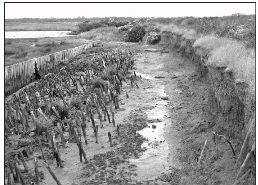
Photo 2 : forte érosion de la digue frontale de Malprat, dans le bassin d'Arcachon (sept. 2008). On reconnaît les anciens piquets de fondation de la digue. Son recul actuel est clairement matérialisé par des piquets plus récents (à gauche des premiers), qui devaient aider pendant un temps à son renforcement. Le CEL a conservé les brèches qui se sont produites, acceptant cette dépoldérisation accidentelle pour réduire entre autres les coûts d'entretien des digues.

cet organisme à rendre ces sites sensibles à la mer – ce qu'il a d'ailleurs déjà réalisé à plusieurs reprises, en laissant ouvertes des brèches qui s'étaient accidentellement produites. Il est vrai que la philosophie du Conservatoire est celle d'une absence de résistance à la mer, de façon à conserver les aspects naturels des sites et leurs équilibres écologiques. Ainsi, si l'objectif du Conservatoire n'est pas prioritairement défensif, comme dans le cas du managed realignment , il peut toutefois l'être indirectement, puisqu'il peut souhaiter – en acceptant des dépoldérisations accidentelles ou en dépoldérant volontairement – réduire le coût d'entretien de digues défectueuses, tout en contribuant à une restauration écologique (cf. photo 2).