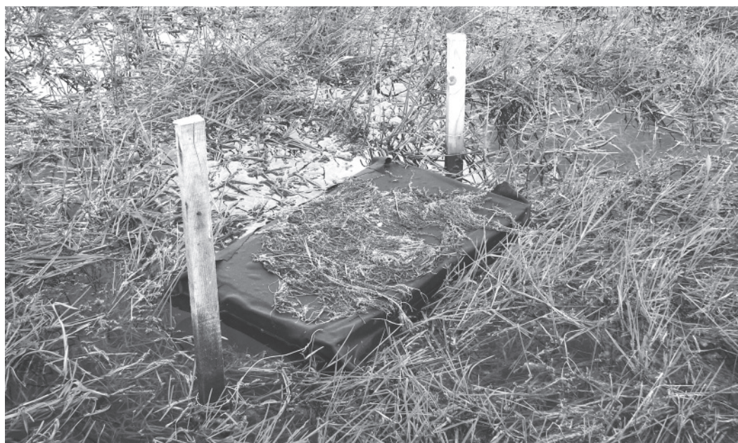
Photo 1 : Radeau-nichoir installé sur le communal des Magnils-Reigners en 2008 (Photo © Alain Thomas) Floating nest platform in the communal des Magnils-Reigners in 2008 (Photo © Alain Thomas)

Certains sites où nichent les guifettes font l'objet de deux types de mesures de gestion : i) pose de « radeaux-nichoirs » sur 7 sites au moins 1 année (photo 1), ii) exclusion du bétail (pose de clôtures ou retrait temporaire du bétail pendant la période de nidification ; 12 sites au moins 1 année). De 1992 à 2008, nous avons testé l'impact de ces deux mesures de gestion sur les 3 paramètres populationnels suivants : le nombre de couples s'installant sur la prairie, le nombre de poussins menés à l'envol et le succès de reproduction moyen des couples.