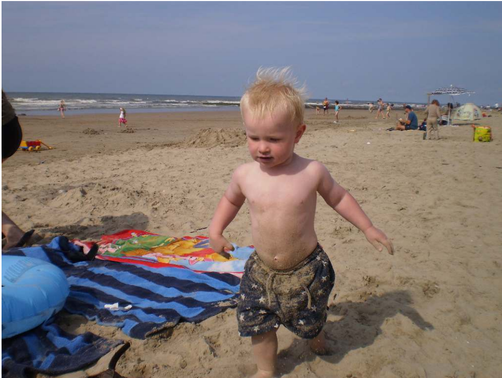
Figure 1. Appropriations spatiales éphémères : Plages de Westende (B) et de Botlenhagen (D).