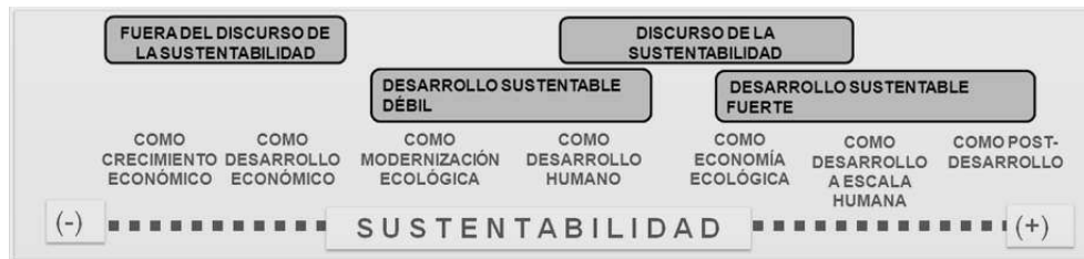
FIGURA 2: CLASIFICACIÓN DEL CONCEPTO DE DESARROLLO EN FUNCIÓN DE LA NOCIÓN DE SUSTENTABILIDAD