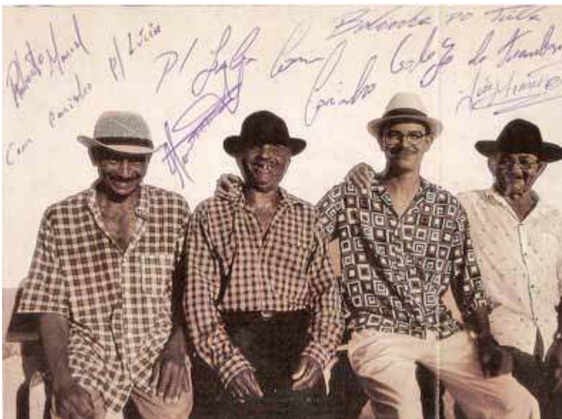
Fig. 1. Couverture du CD Fuloresta do Samba .