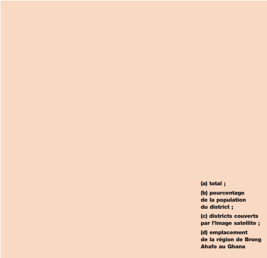
Figure 3. Immigration Dagaba par district pour la région de Brong Ahafo, Ghana

Ils soulignent toutefois que cette conversion des terres dans la zone de transition forêt-savane n'est pas un processus linéaire de dégradation, mais plutôt une interaction complexe, dynamique et multidirectionnelle de facteurs humains et naturels. Les sites ayant une agriculture mécanisée et à forte pression externe ont montré le moins de potentiel de régénération, parce que toute la végétation, y compris les souches et les racines, était arrachée. Dans des zones où les systèmes de jachère forestière dominaient, il y avait une forte conversion de forêt en terres agricoles, mais aussi de nombreux changements dans le sens opposé.