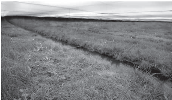
11. Job Koelewijn, Jump , 2005, œuvre installée dans la Galerie Fons Welters, Amsterdam, en 2006.

(fig. 11). Enfin, le design néerlandais – ce qui nous ramène à l'architecture – tend à être fonctionnel et démocratique. Plutôt que des objets exclusifs, ces produits sont créés pour un marché plus large. Comme les Néerlandais eux-mêmes, leur design contemporain est modeste et pratique, et avec sa pointe d'humour, il est aussi extrêmement attirant.