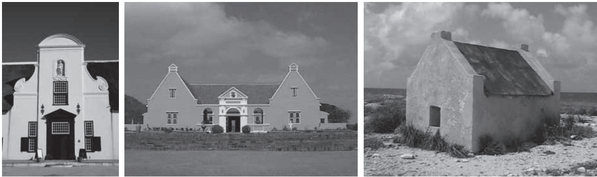
9a. Groot Constantia, Le Cap, Afrique du Sud, 2006 ; b. Landhuis Groot Santa Martha, Curaçao, 2004 ; c. Cabane d'esclave, Bonaire, 2004.

Julie Hochstrasser. Que l'on observe les plantations du Curaçao ou l'architecture Cape-Dutch en Afrique du Sud, on repère vite leurs traits indéniablement néerlandais – même lorsqu'elle est masquée par le blanc éclatant des édifices du Boland ou le jaune enjoué des bâtiments aux Caraïbes (fig. 9a et b) 24 . Même les cabanons d'esclaves du Bonaire suggèrent des formes distinctement hollandaises (fig. 9c). Il s'agit sans aucun doute de quelque chose de spécifique, mis en relief par le contexte mondial. La prise en compte de l'architecture – et surtout de styles développés ailleurs dans le monde mais avec des racines communes – confirme qu'il existe bel et bien une identité néerlandaise distincte dans les arts visuels, et contribue à cristalliser ses caractéristiques.