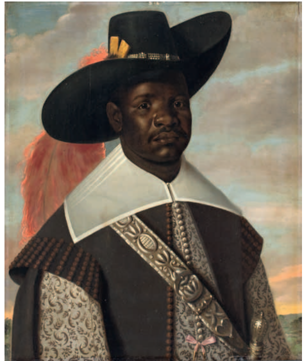
1. Jaspar Beckx, Don Miguel de Castro, émissaire du Congo , avant 1647, Copenhague, Statens Museum for Kunst.