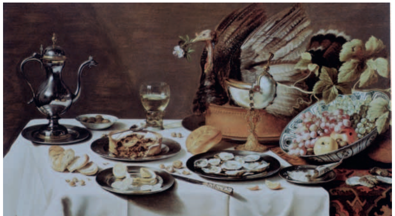
2. Pieter Claesz., Nature morte avec une tarte à la dinde , 1627, Amsterdam, Rijksmuseum.