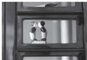
7. National Automatiek innl, vue et détail du distributeur d'« objets historiques » installé au Nationaal Historisch Museum à Amsterdam en 2011.

projets participatifs et les perspectives locales provient vraisemblablement de la richesse des savoirs locaux que partagent les institutions et leurs publics. Le Musée d'histoire nationale (Nationaal Historisch Museum) à Amsterdam, par exemple, a développé le « Nationale Automatiek innl » (fig. 7), un distributeur qui contient quatre-vingts « objets historiques » accompagnés chacun d'une légende et d'un petit film. Le visiteur s'inscrit au distributeur (devenant en même temps membre du musée) et procède à l'achat d'un objet (pour un ou deux euros). L'objet réceptionné, le visiteur peut lire le cartel, regarder le film qui lui correspond, prendre un autre objet, ou encore participer sur Internet