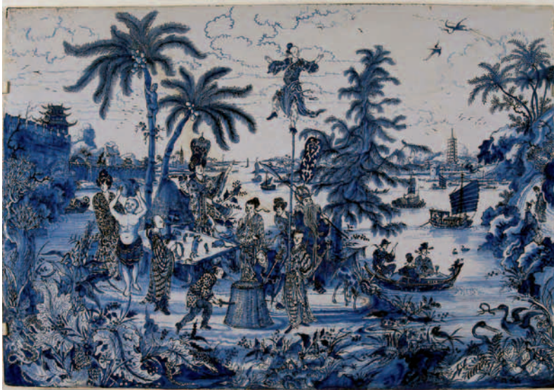
4. Plaque de faïence de Delft ornée de chinoiseries, utilisée comme décoration murale, 1680-1700, Amsterdam, Rijksmuseum.

d'Orsay à Paris en 1986 a suscité aux Pays-Bas un grand débat sur l'intérêt de créer une institution similaire. Si les Français ont pu créer un musée aussi impressionnant pour exposer les chefs-d'œuvre des artistes, architectes et créateurs français du XIX e siècle, ne pouvait-on en faire de même à Amsterdam avec l'art néerlandais ? Après plusieurs mois de débats passionnés, le ministère de la Culture a mis fin à la discussion en déclarant que, contrairement à son homologue français, il ne souhaitait pas se lancer dans des « grands travaux », et que les Néerlandais devraient se contenter des musées existants 11 . Nonobstant cette fin abrupte, le débat en lui-même fut fascinant. Il semblait y avoir un consensus général : il était parfaitement acceptable de soutenir le Rijksmuseum, le musée national d'art et d'histoire mondialement connu pour ses collections du Siècle d'or, mais revendiquer une place importante pour la culture et l'art néerlandais modernes était autrement problématique. Pour beaucoup, l'art néerlandais n'était pas suffisamment intéressant pour justifier un tel traitement de faveur ; d'autres critiques citaient l'impossibilité du projet, soutenant que l'art après 1800 relève d'une histoire internationale et non nationale.