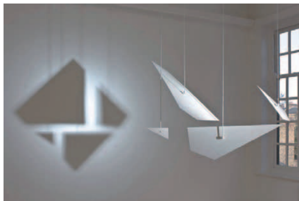
5. Germaine Kruij, Counter Shadow , 2007, Londres, galerie The approach.

Néanmoins, les espaces d'art contemporain, soutenus par un public curieux, manifestent un intérêt croissant pour les artistes néerlandais. La chaîne nationale AVRO a produit, en partenariat avec le Fonds pour les arts visuels, le design et l'architecture (BKVB), une série télévisée présentant principalement des artistes néerlandais 12 . De même, la Kunsthall à Rotterdam, en collaboration avec la radiodiffusion régionale, a commandé une série de programmes et une exposition sur les « maîtres néerlandais du XXI e siècle » 13 . Le musée Paviljoens à Almere a lancé un projet sur trois ans intitulé « L'identité hollandaise ? » (2010-2012), consacré exclusivement aux artistes néerlandais et à ceux travaillant et résidant aux Pays-Bas, et qui abordent la question de la Dutchness dans leur travail. C'est ainsi que le Paviljoens a présenté des expositions monographiques de Job Koelewijn et de Germaine Kruij, mais aussi de Meschac Gaba, d'origine béninoise. Les deux premiers appartiennent à la tradition artistique néerlandaise : Koelewijn par son approche austère et parfois philosophique du quotidien (fig. 11), Kruij pour ses sculptures de lumière qui rappelle De Stijl (fig. 5), et tous les deux pour leur vocabulaire moderniste mettant l'accent sur la tactilité. En revanche, Gaba, qui vit et travaille aux Pays-Bas mais qui réalise des installations alliant préoccupations occidentales et traditions africaines, est plus difficile à placer dans un contexte de Dutchness 14 .