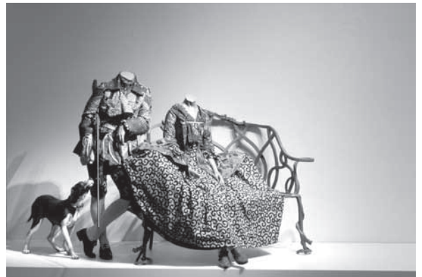
8. Yinka Shonibare, Mr. and Mrs. Andrews Without Their Heads , 1998, Ottawa, Musée des beaux-arts du Canada.

production locale) qui témoigne de cette fécondation mutuelle 21 . Pour donner un exemple très actuel, la « cire hollandaise », batik très prisé en Afrique de l'Ouest, fut introduite au Ghana grâce au commerce hollandais mais prend son origine dans une technique indonésienne. Il est aujourd'hui utilisé par l'artiste anglais d'origine nigérienne Yinka Shonibare dans ses œuvres et installations postmodernes précisément en raison de ses connotations coloniales (fig. 8) 22 – une allusion qu'on ne peut pleinement apprécier que si l'on a conscience du contexte historique. Et il y a beaucoup d'exemples de ce genre ! 23