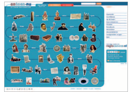
3. Page d'accueil du site Internet entoen.nu: de canon van Nederland ( http://entoen.nu ).

Dans un contexte de mondialisation, les gens ont tendance à s'accrocher davantage à leur identité néerlandaise (blanche, occidentale). Naturellement, cela soulève une question importante : « Que signifie être néerlandais ? » Ce débat a été alimenté par la publication en 2006 d'un rapport réalisé par un comité gouvernemental inquiet du niveau déplorable des connaissances historiques des élèves néerlandais, qui a donné lieu par la suite à la création du site Internet entoen.nu : de canon van Nederland (fig. 3) 8 . Présenté sous la forme de cinquante fenêtres, chacune pourvue d'une icône accrocheuse, le site ouvre sur différents aspects de l'histoire et de la culture néerlandaises, embrassant aussi bien les tombes mégalithiques, l'art de l'imprimerie et Rembrandt que l'esclavage, la découverte d'un champ de gaz important aux Pays-Bas vers 1960 et la participation néerlandaise à l'Europe. Que l'on considère cette initiative d'un bon ou d'un mauvais œil, elle a fait éclater une fois de plus le débat sur l'identité néerlandaise et nourri des sentiments de nationalisme activés par les forces politiques de l'extrême droite néolibérale des Pays-Bas.