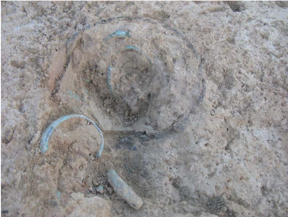
Fig. 3 – Vue de détail de ce qui restait du dépôt de bracelet en bronze au moment de sa découverte

Auteur(s) : Aubry, Laurent (Inrap). Crédits : L. Aubry (2009)