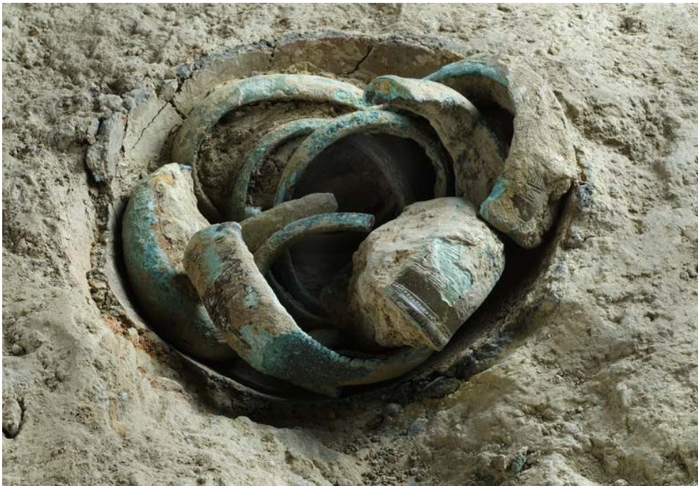
Fig. 6 – Restitution hypothétique du dépôt

Auteur(s) : Paitier, Hervé (Inrap). Crédits : H. Paitier (2009)