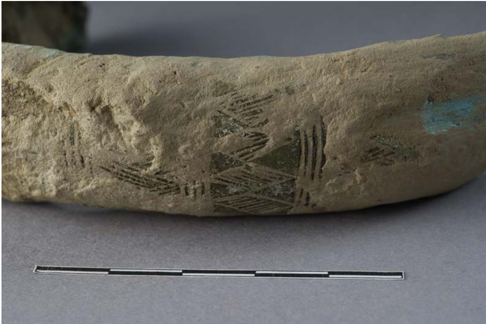
Fig. 5 – Décor conservé sur le bracelet n°1