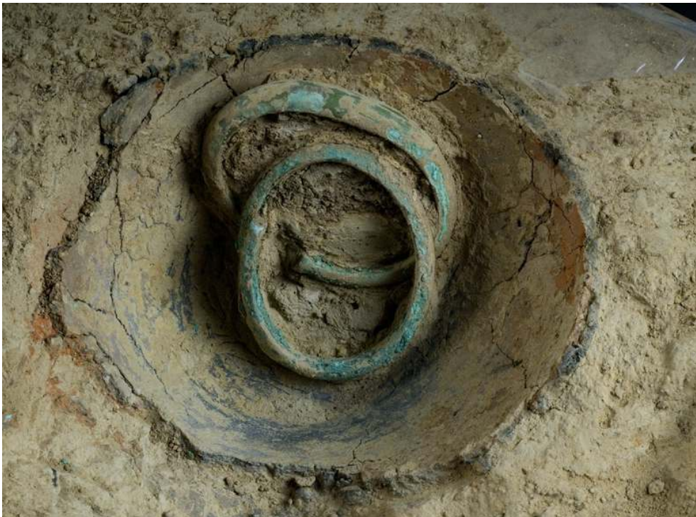
Fig. 4 – Bracelets n°6 (premier plan) et n°7 (second plan) encore en place dans le vase