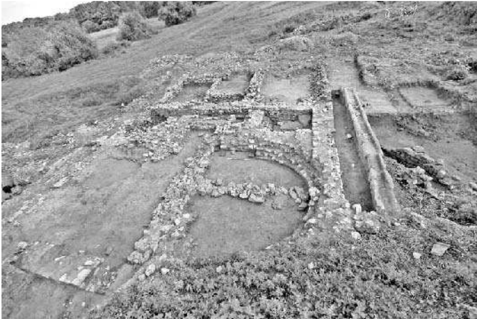
Fig. n°3 : Cheberne : caldarium

Auteur(s) : Hénique, Jérôme (Hadès). Crédits : Hénique, Jérôme (2007)