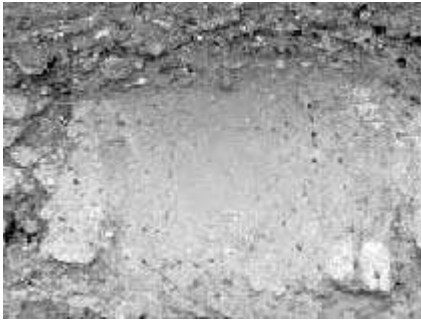
Fig. n°1 : Détail du Terrazzo mis au jour dans la tranchée de sondage 2