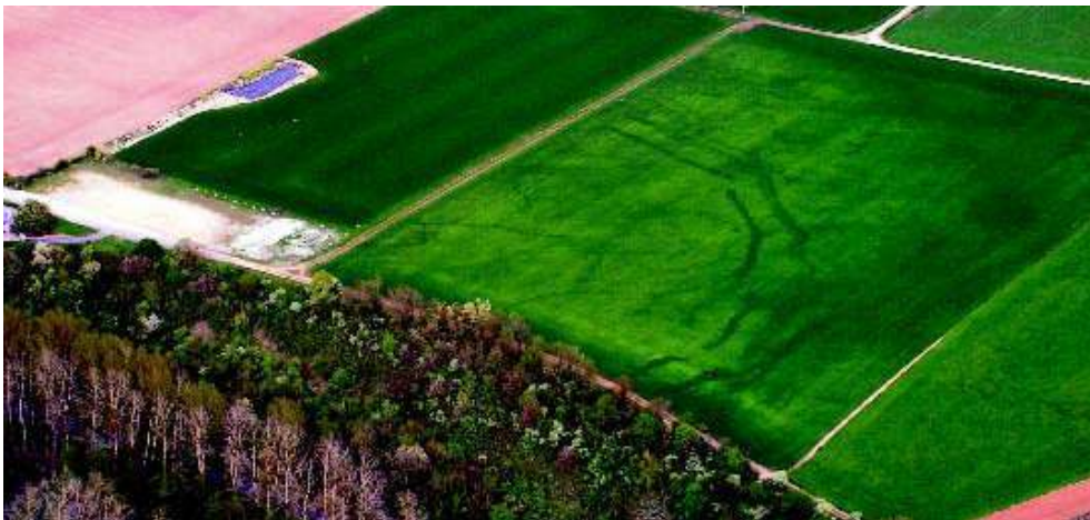
Fig. n°2 : Vue aérienne de l'enceinte néolithique prise en avril 2009. Les deux fossés s'appuient sur un abrupt dominant la Charente