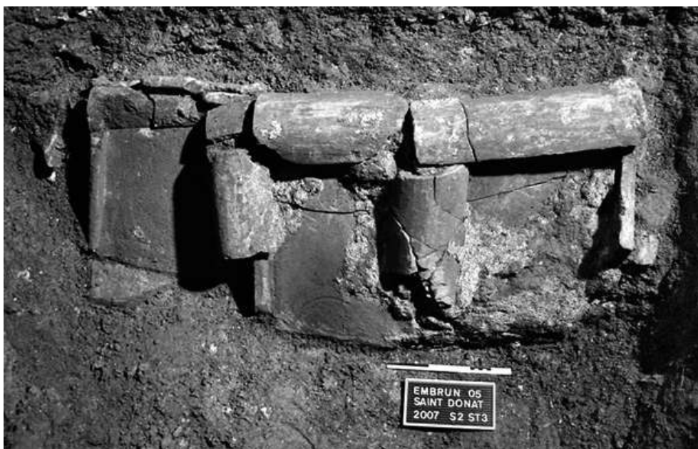
Fig. n°2 : Vue de la tombe en coffrage en tuiles sous bâtière

Auteur(s) : Deverly, Daphné. Crédits : ADLFI (2007)