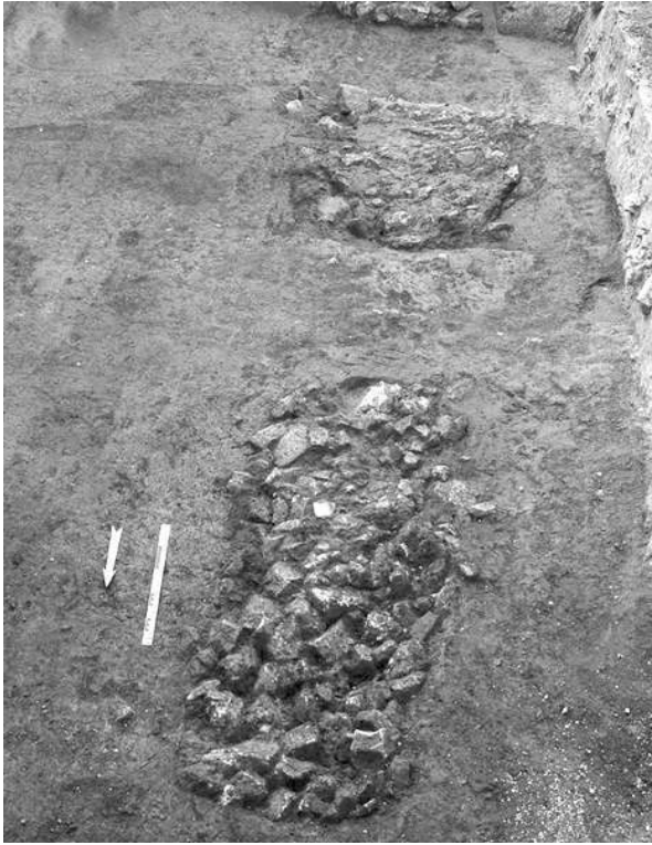
Fig. n°3 : Vue d'un alignement de fosses à pierres chauffées. Les deux fosses au premier plan conservent encore leur remplissage, la fosse visible à l'arrière-plan a été vidée