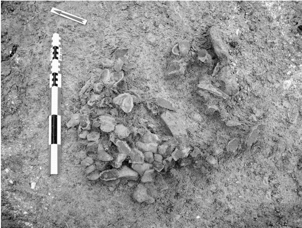
Fig. n°1 : L'amas de débitage St 1, sd 24