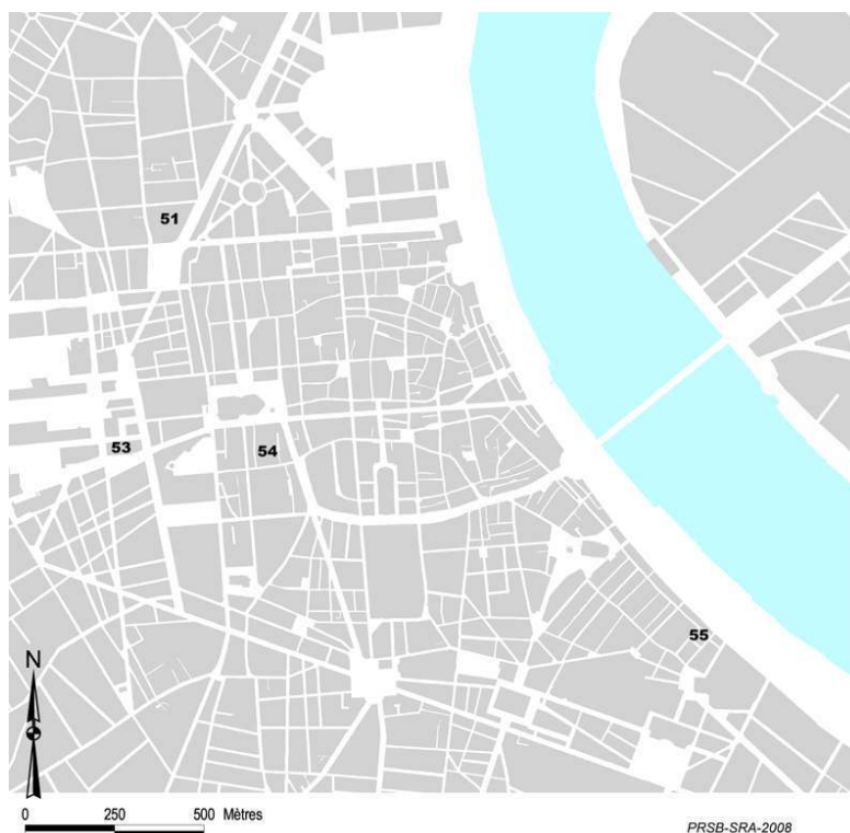
Fig. n°1 : Bordeaux - Carte de localisation