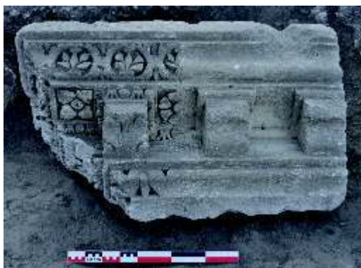
Fig. n°2 : Le théâtre : fragment de corniche modillonnaire corinthienne

Auteur(s) : Nadeau, Antoine (COL). Crédits : Nadeau Antoine COL (2009)