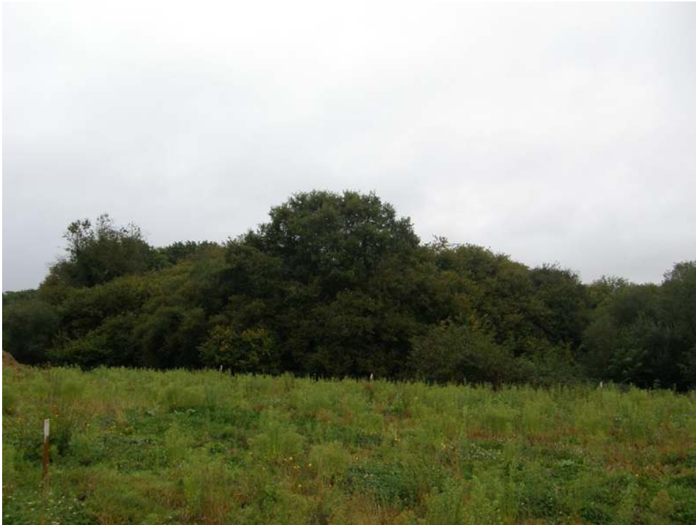
Fig. 1 – Vue depuis l'ouest de la motte de Pen Hastel masquée par la végétation