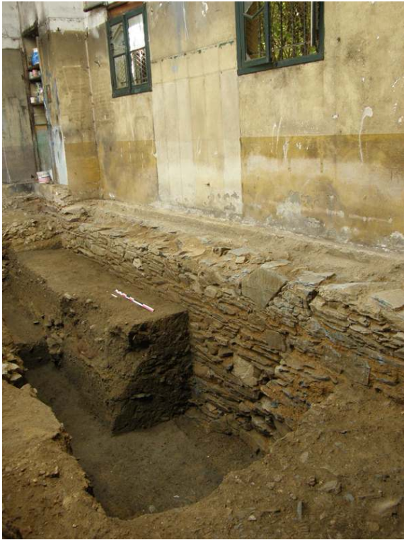
Fig. 1 – Vue d'ensemble du mur 2001