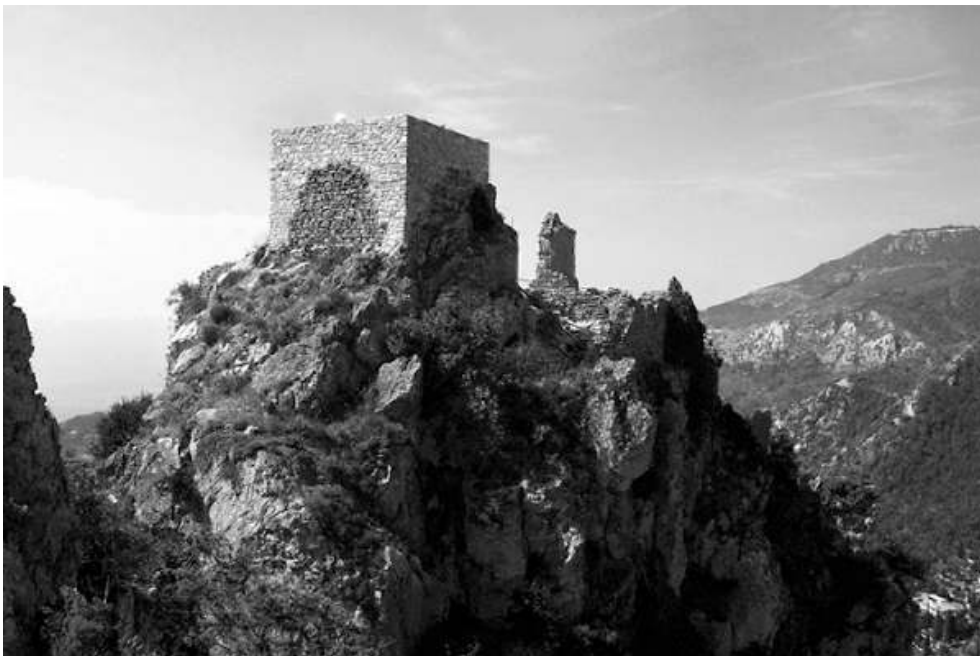
Fig. n°1 : Vue de la tour maîtresse de Sainte-Agnès