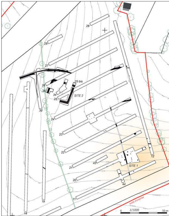
Fig. 1 – Localisation du site 1 (site néolithique)