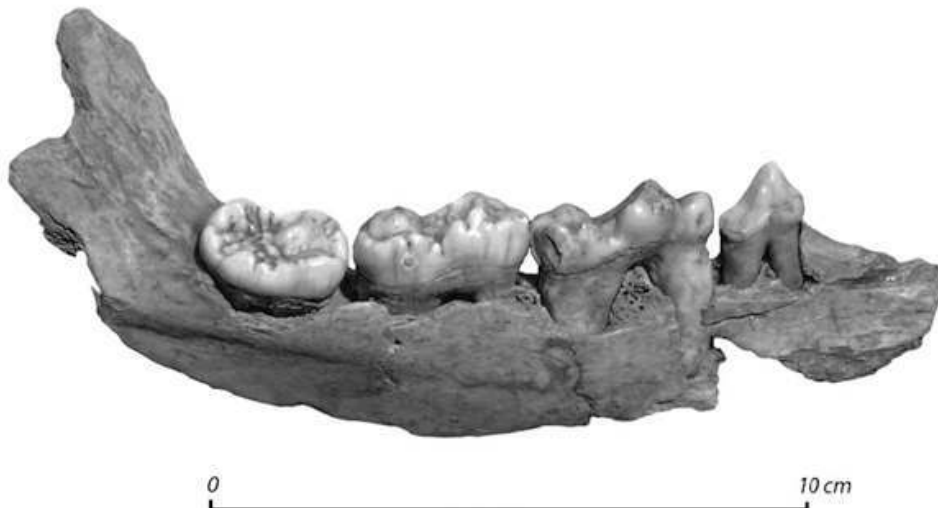
Fig. n°1 : Mandibule gauche d'ours des cavernes ( Ursus spelaeus )

Auteur(s) : Moullé, Pierre-Élie. Crédits : ADLFI (2007)