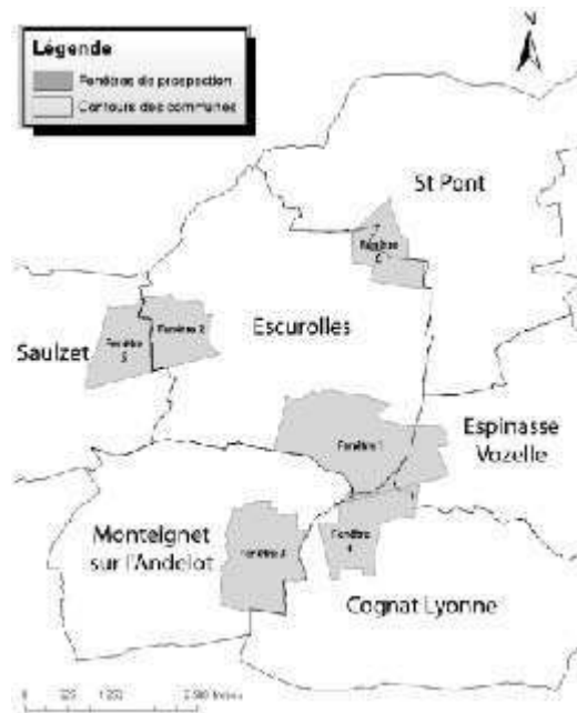
Fig. n°1 : Cartographie des secteurs prospectés

Auteur(s) : Ducreux, Jérôme (BEN).