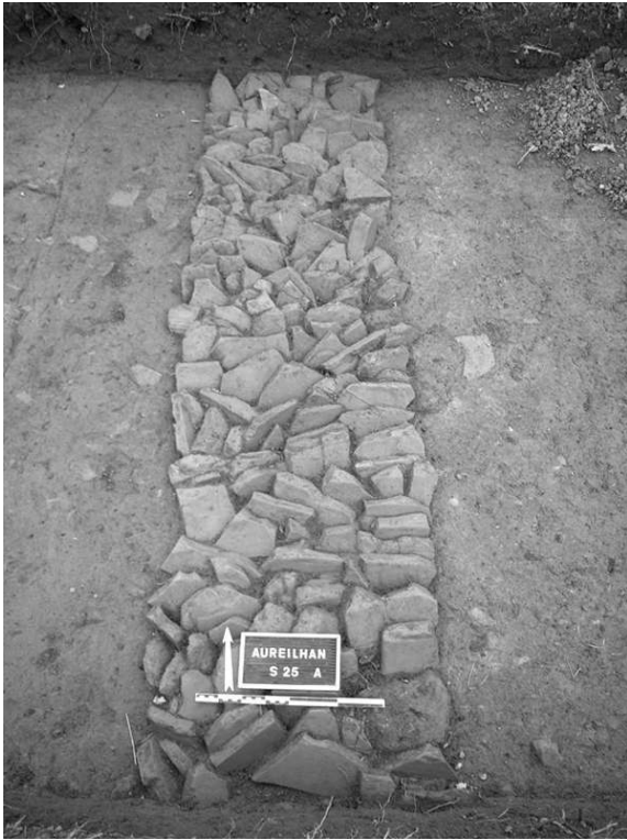
Fig. n°1 : Fondation en tuile