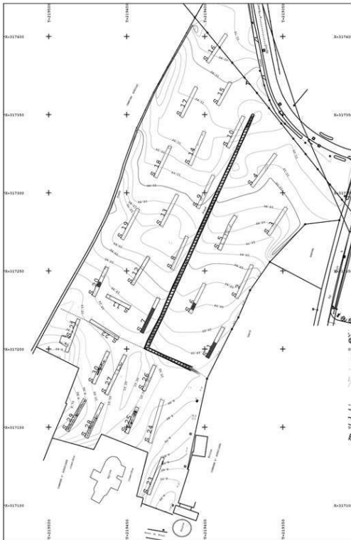
Fig. n°3 : Plan général des sondages